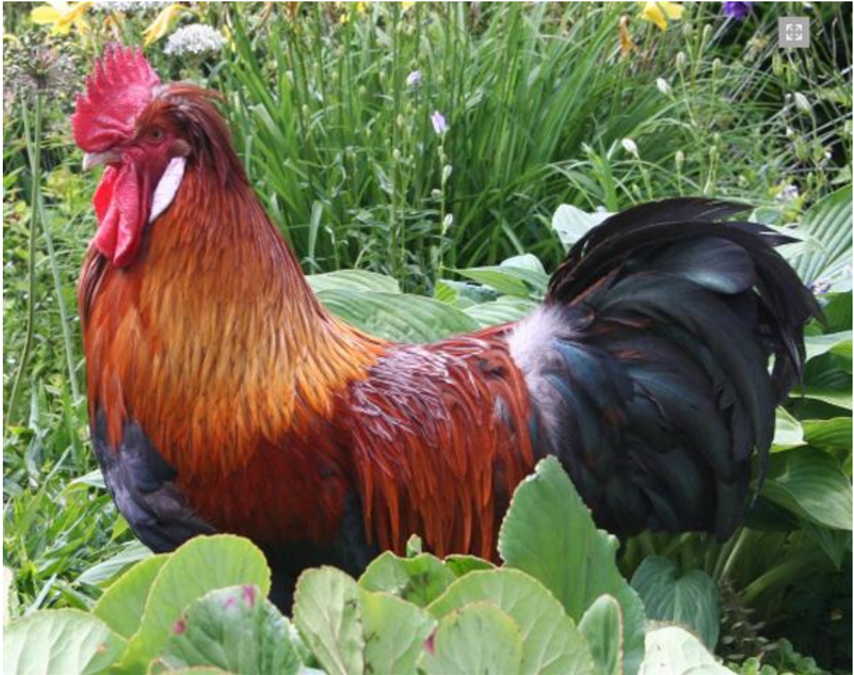
Boven: Sulmtaler haan. Foto NL Speciaalclub van Sulmtalers en Altsteirers. Onder: Sulmtaler hennen. Foto NL Speciaalclub van Sulmtalers en Altsteirers.