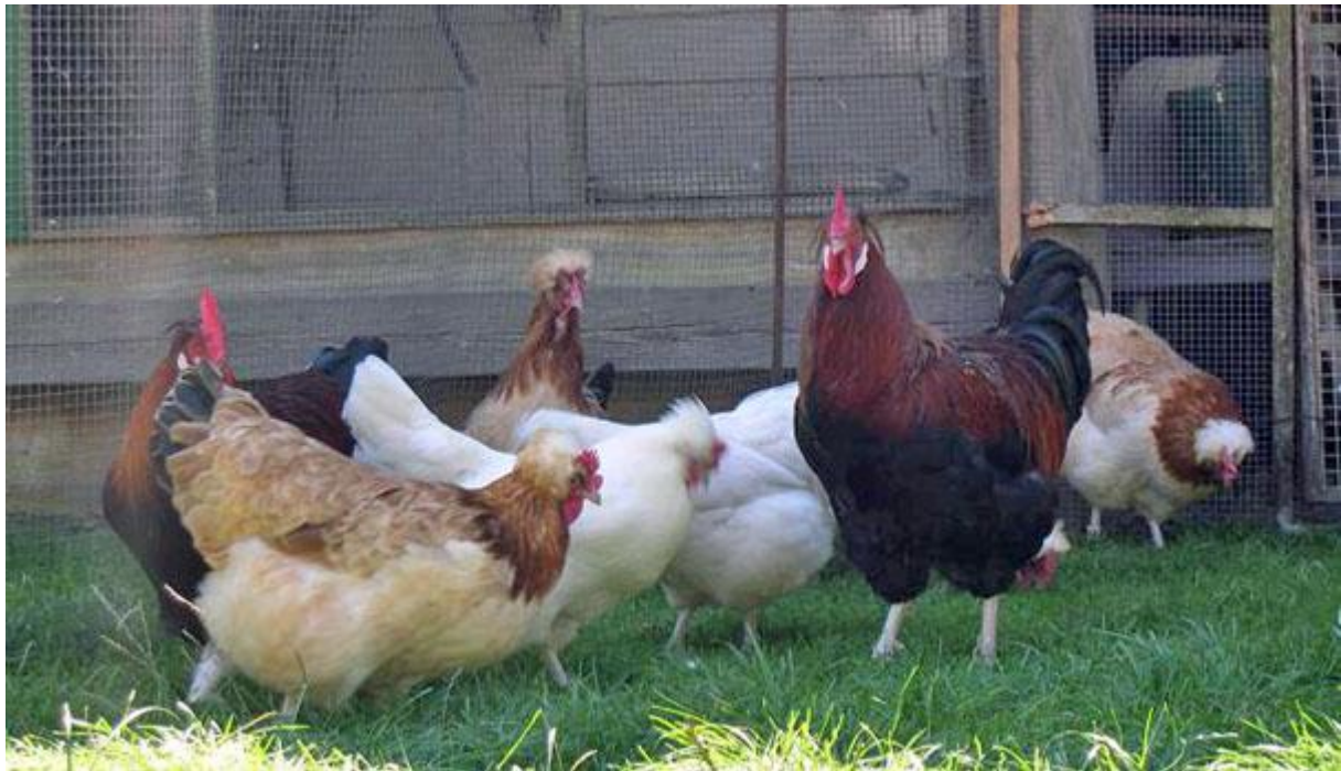
Boven: Witte en tarwe Sulmtalers in Oostenrijk bij fokker Karl Schachinger.

In Nederland zijn de groten alleen erkend in de kleurslag tarwe; de krielen ook in blauwtarwe. De kleur 'tarwe' is genoemd naar de kleur van de hen. Rug en vleugels zijn tarwekleurig, meestal wat donker tarwe. Het kuifje en de borst zijn licht-tarwekleurig; buik en dijen zijn liefst nóg wat lichter van kleur. De kop en de hals zijn roodbruin met zo weinig mogelijk zwarte halstekening. De staartveren zijn dofzwart, behalve de 2 bovenste, die tarwe met zwart gespikkeld zijn, net als de slagpennen. De bijpassende haan is min of meer patrijkskleurig, maar dan wat roodbruiner in hals- en zadelbehang, waarin géén schachtstreep-tekening aanwezig is. Ook het kuifje is roodbruin. Bovendien is bij dit ras enige roodbruine tekening in de (zwarte) borst toegestaan.