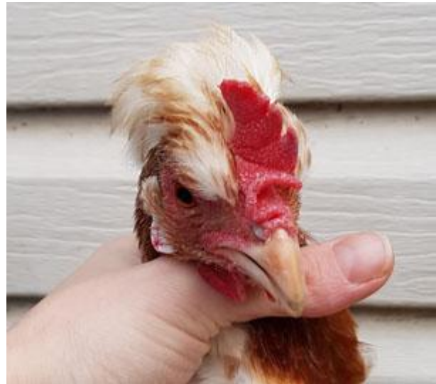
Boven: Wikkelkam met te weinig wikkel en ideale wikkelkam.