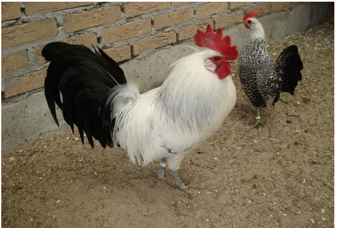
GRONINGER MEEUWEN http://www.aviculture-europe.nl/nummers/12N05A05.pdf