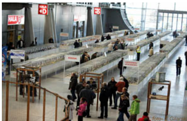
Nationale Kleindiertentoonstelling – KIELCE, POLEN