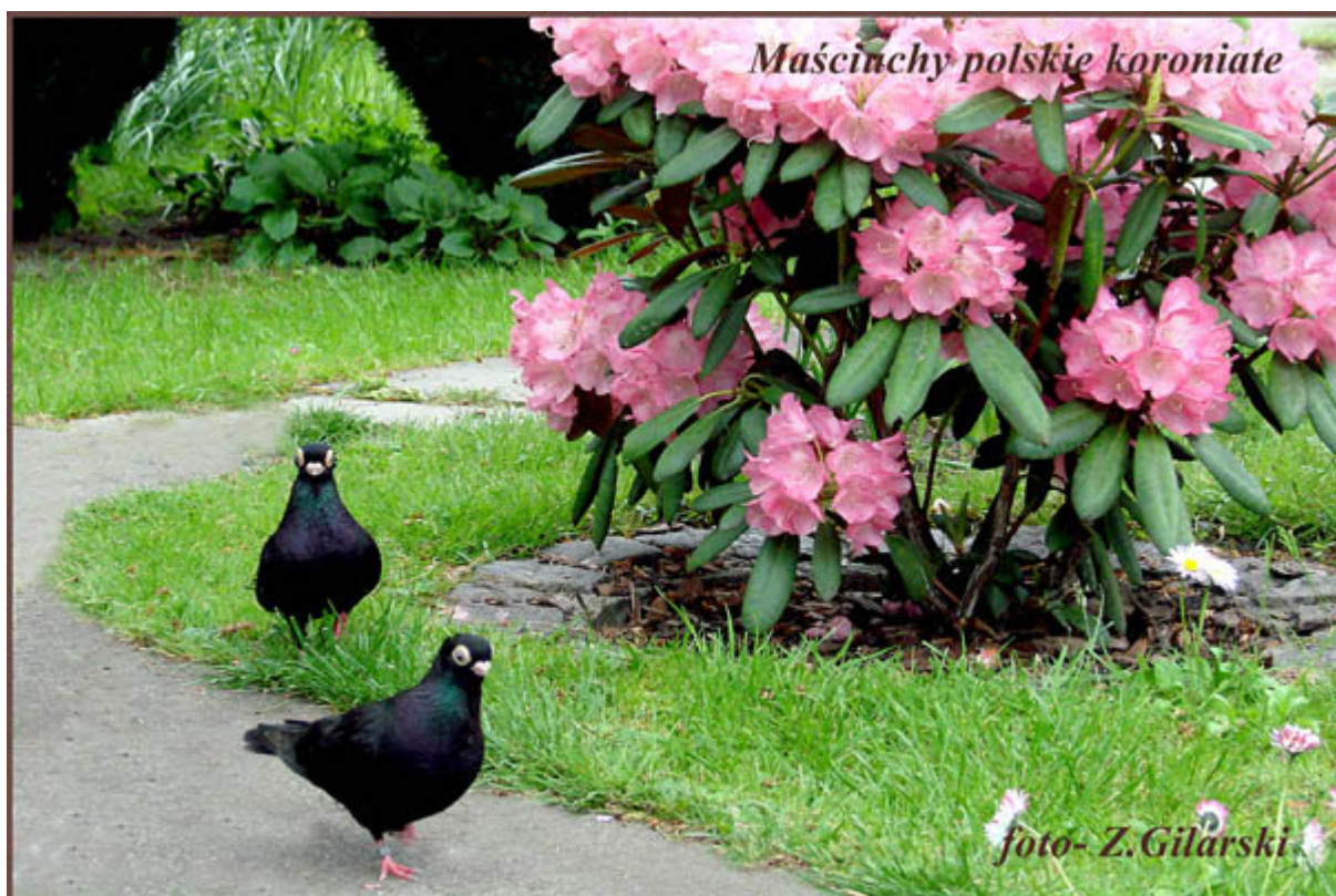
Poolse Masciuch Tuimelaar