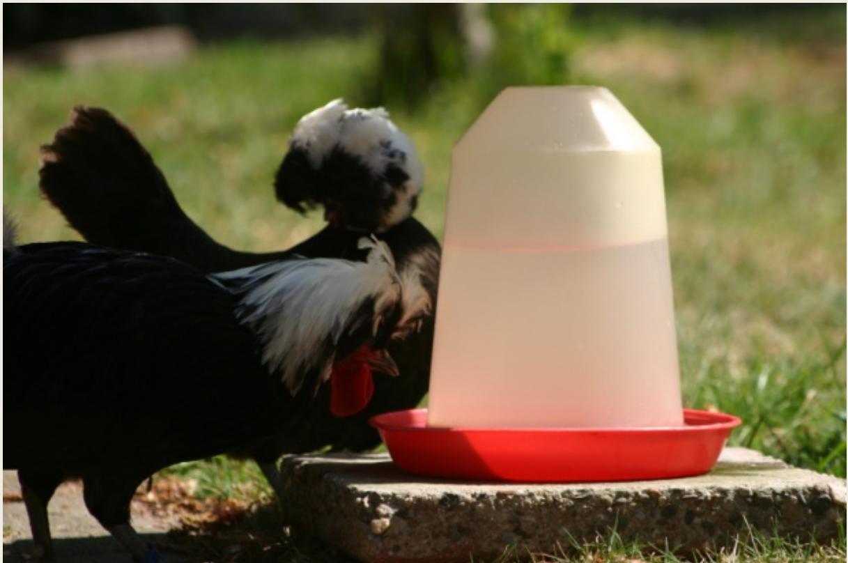
Drinkende zwarte witkuifkrielen. Fokker: Luuk Hans.

Niet in de laatste plaats leidt een nieuwe kuif vaak tot enige huidirritatie en laten kuifhoenders zich graag pikken in de kuif. Vooral ander (kuifloze) rassen kunnen dan iets te enthousiast zijn. Met kale plekken op de kuif, of erger, tot gevolg.