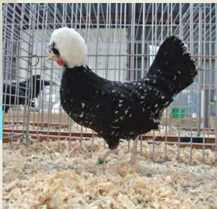
Rechts: Zwartbont witkuif krielhen. Gallinova 2013. Fokkers: Comb. Gahrman.