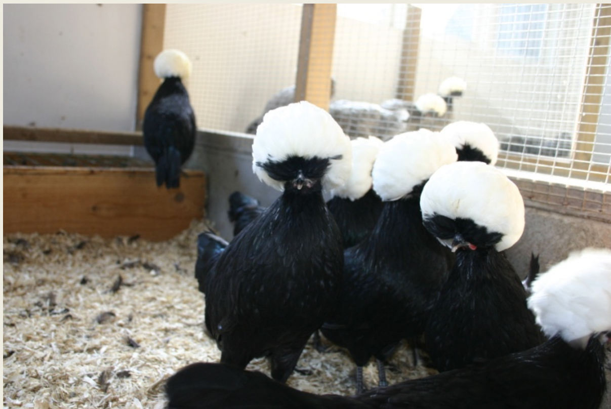
Boven: Zwart witkuif krielhennen. Fokker: Wim Diepenbroek.

Het meeste ziet men de zeer contrastrijke zwarte witkuif, die al in de 16 de eeuw voorkwam. Het meest bijzonder is het verhaal van de witte zwartkuif, die rondom het midden van de vorige eeuw is teruggefokt. Toch kwam deze kleurslag blijkbaar al voor in de 15 de eeuw. Daar zijn boeiende verhalen over. Niettemin een nog steeds weinig voorkomende kleurslag vanwege de hoge moeilijkheidsgraad bij het fokken.