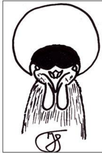
Fig. 4. Dit is de ideale vorm van het vederbosje. Het ziet er uit als een halve cirkel of krans.

Bij het knippen (conditioneren) van de kuif werken we van achteren naar voren. De enkele zwarte veren in het witte gedeelte van de kuif – bij een zwarte witkuif – worden vlak bij de hoofdhuid afgeknipt. Dit gaat het handigst met een nagelschaartje. Als op deze manier de her en der verspreid staande veren zijn verwijderd, moeten we nog wat zwarte veren voorin de kuif op dezelfde wijze wegknippen, zodat een bescheiden gekleurd vederbosje voor in de kuif ontstaat.