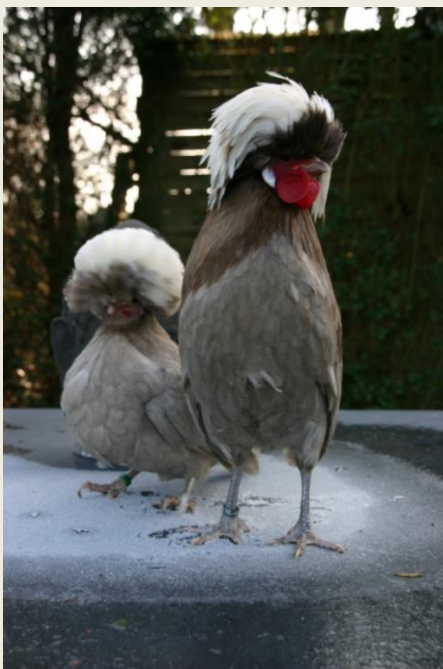
Links: Khaki kuifhoenkrielen. Fokker: Luuk Hans.

De nieuwste kleurslag, die erkend is, is de Chocolatebonte Witkuifkriel. Een kleurslag die geheel van Nederlandse makelij is.