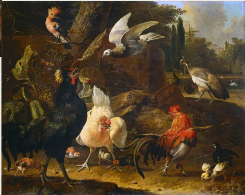
Rechts: 'Vogels in het park', Melchior d'Hondecoeter, 1686.