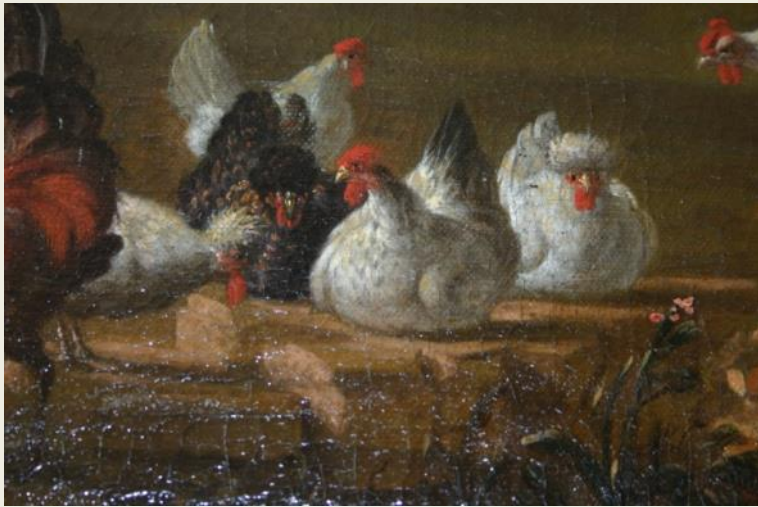
Links: Uitsnede uit schilderij in kasteel Gunterstein, door H. en C. Saftleven, 1620.

Deze poëzie gaat nog even zo door maar we weten genoeg.