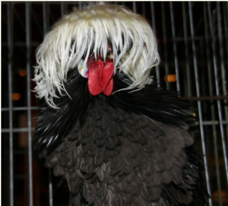
Links: Kopstudie Krulveer zwarte witkuif, krielhaan.