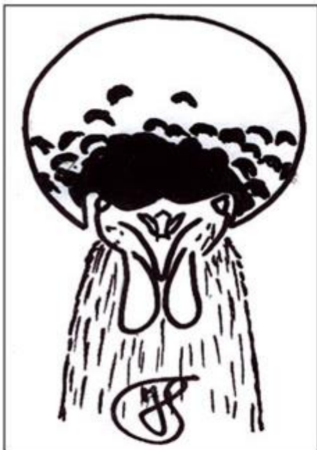
Fig. 1: Een kuifhen, zo uit het hok gehaald, ziet er ongeveer zo uit. Daar moet dus nog wel iets aan geconditioneerd worden.

De enige reden waarom men de gekleurde veren helemaal wegknipte in Nederland – niet in alle landen!- was dat de kuif dan ogenschijnlijk geheel wit leek. Sinds de eeuwwisseling wordt ook in ons land het gekleurde vederbosje vóór de kuif in stand gelaten, met dien verstande dat het wel mag worden bijgeknipt. Zie onderstaande tekeningen, met dank aan Hendrik Timmer.