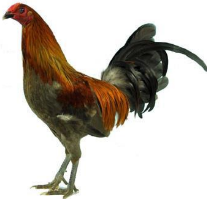
Rechts: Engelse Vechthaan. (Oxford Game)

In veel landen zijn hanengevechten nu verboden, maar niet overal! Verscheidene landen hebben hun eigen vechthaan ontwikkeld, waarbij vaak sprake is van kruisingen. De Maleier, de Shamo en de Oud-Engelse Vechter (OEG) zijn vaak gebruikt om een echte vechtersbaas te creëren. Kijk bijv. naar de oude tijden in Amerika, waar deze rassen vaak werden vernoemd naar hun schepper, zoals hierboven beschreven. De meeste van deze rassen zijn verdwenen.