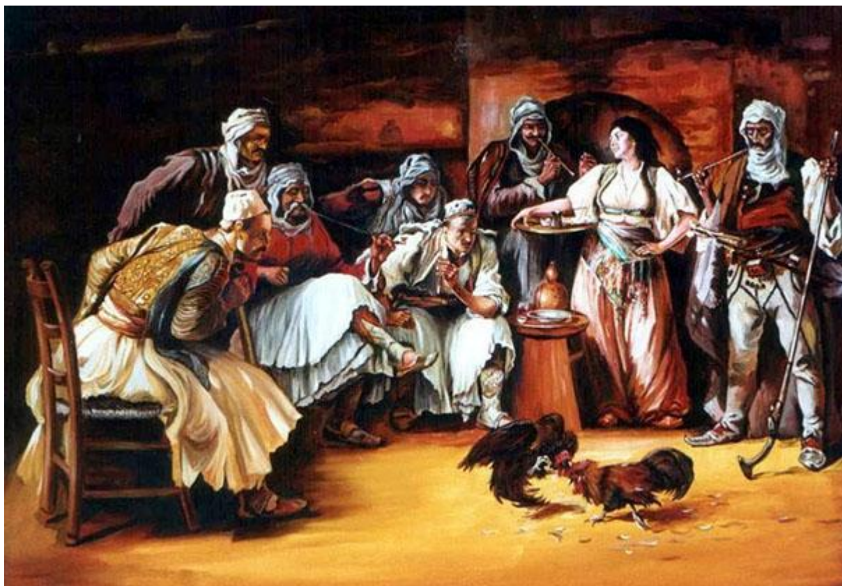
Boven: Hanengevecht in de Balkan, 1883, door Paja Jovanović. Rechtsonder: Mesjes; Amerikaanse makelij.

Maar Amerikaanse gevechten vonden overal plaats: er was geen vaste plek. Eigenaren van vechthanen – er zijn gegevens van gebeurtenissen waarbij 50 tot 60 hanengevechten plaatsvonden – troffen elkaar in een gebied afgebakend met een stuk touw of op een open terrein tussen gebouwen. Hanen vchten met dieren in dezelfde gewichtsklasse, zoals bokkers en worstelaars tegenwoordig doen. Gevechten duurden totdat een haan de ander had gedood, of totdat geen van beiden meer kon vechten. Door de dood van de één was duidelijk wie gewonnen had en beëindigden ook de weddenschappen. Tijdens een hanengevecht ontmoette men oude vrienden en maakte men nieuwe. Sommigen sloten transacties af. Anderen bezochten feesten na de hanengevechten. Tijdens de gevechten juichte het publiek, dronk, at en vloekte.