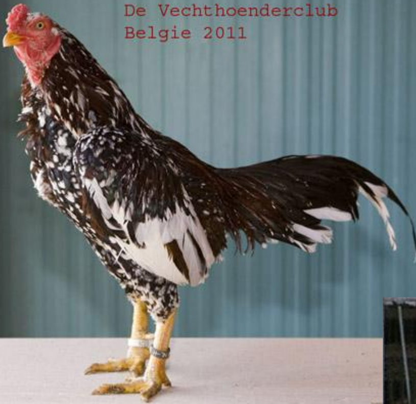
Rechts: Kopstudie Maleier haan.

Vaak realiseren mensen zich niet dat rassen zoals het Sumatra hoen uit Indonesië en de Japanse Satsumadori zijn begonnen als vechthoenders. Andere rassen, zoals de eerdergenoemde Maleier, Shamo, Oud-Engelse Vechter en de Aseel zien er veel meer uit als echte vechtersbazen. De meeste vechthoenderassen in vele delen van de wereld hebben wat weg van de Maleier.