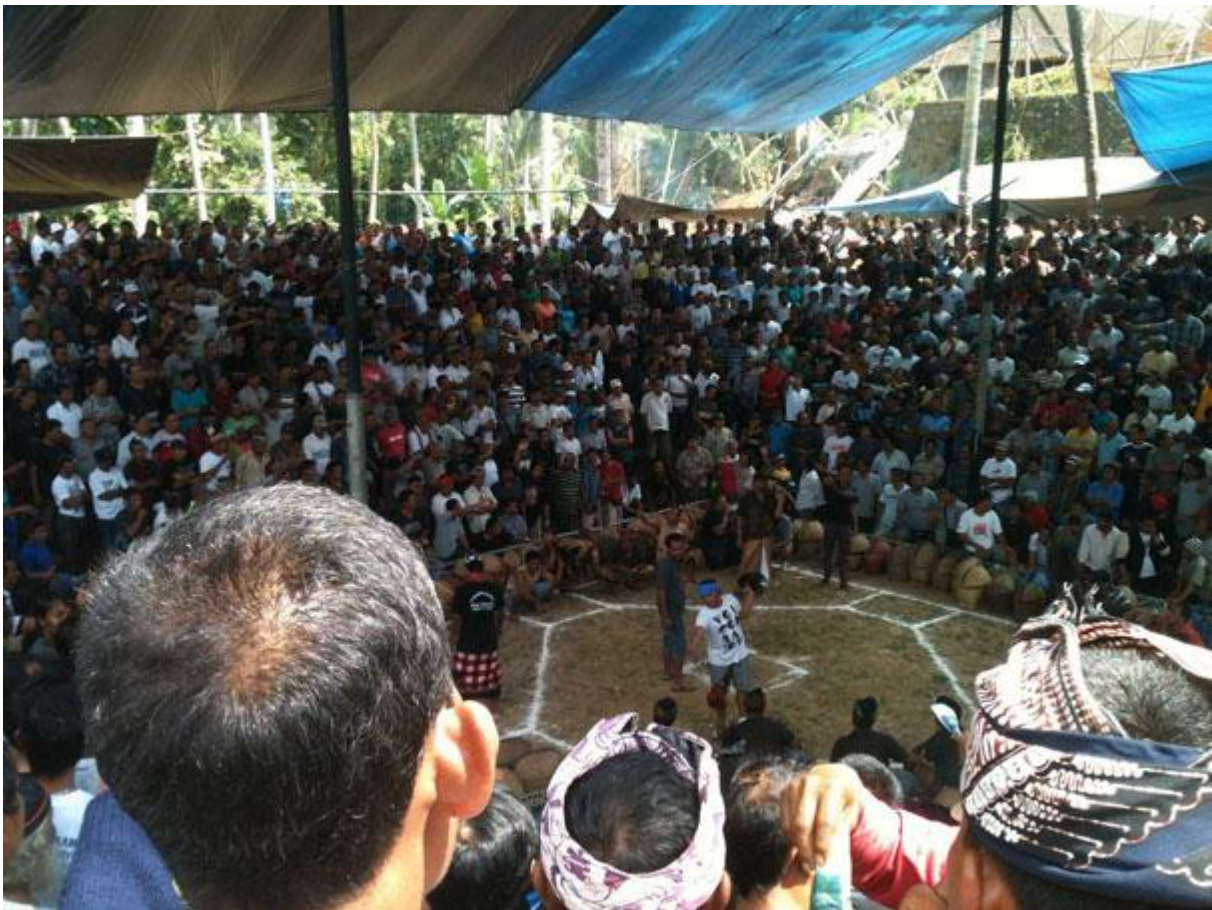
Boven: Hanengevechten op Bali, door Keller, 2012. (Archief W. van Ballekom)