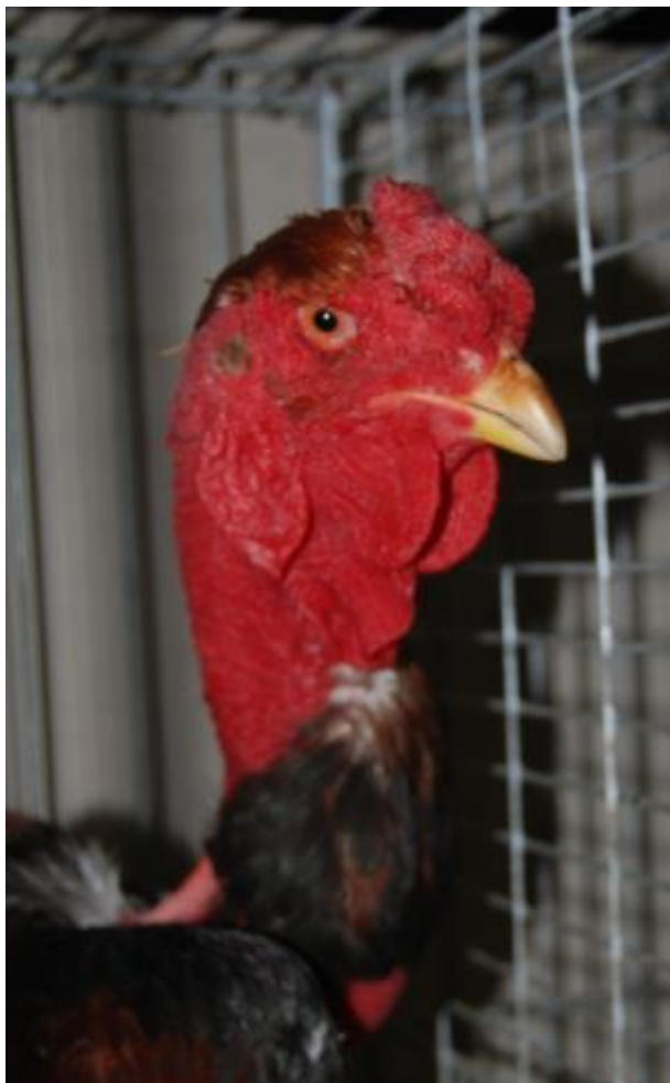
Links: Kopstudie Madagaskar vechthaan.

In de VS bereikten hanengevechten hun hoogtijdagen tussen 1750 en 1800. Hanengevechten waren door het gehele land redelijk populair, maar uitzonderlijk populair in de zuidelijk staten, in het bijzonder in de staat Louisiana. Amerikaanse eigenaren van vechthanen fokten hanen voor speciale (vecht) doeleinden. Ze fokten uitgesproken vechtdieren met namen zoals de fameuze Hatch, Kelso, Whitehackles en andere stammen. Hanengevechten werden minder bezocht nadat de Burgeroorlog uitbrak.