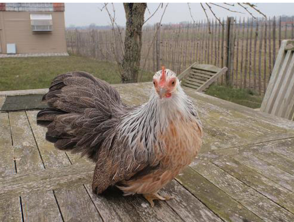
Links: Ohiki hen van Milan van Landuyt, België.

Als de kuikens uitkomen staan ze vaak nog wat wiebelig op hun kleine pootjes, daarom moeten erg energieke kuikens (zoals kuikens van vechthoenders etc.) niet in dezelfde broedmachine uitkomen, want dan worden Ohiki kuikens vertrapt. Eenmaal vol-groeid, zijn ze gehard, levendig en toch zeer tam.