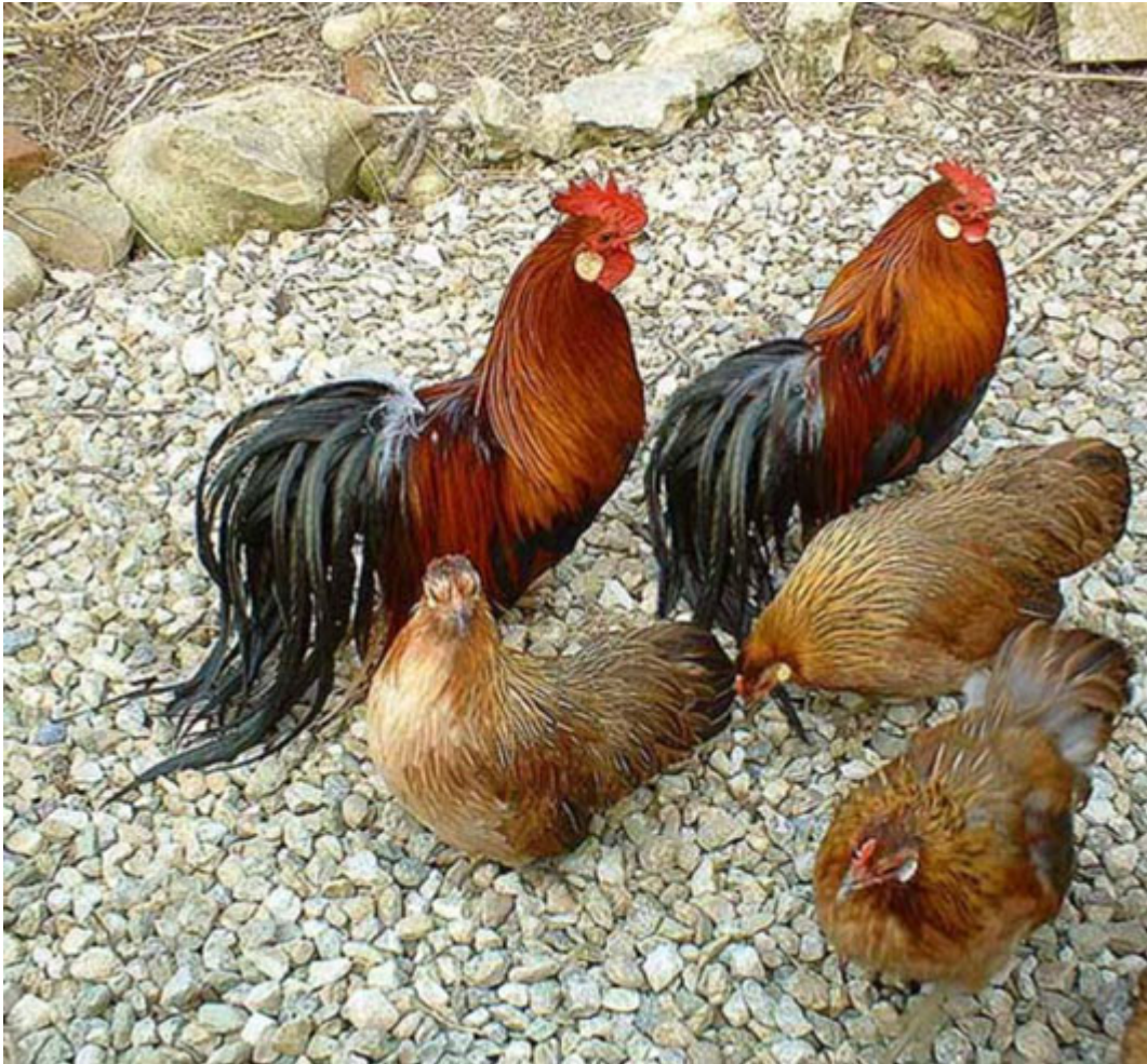
Boven: Ohiki.

Belangrijk bij dit ras is dat de houding vergelijkbaar is met de Chabo of Cochinkriel, waarbij de romp van deze kleine hoenders goed hoog wordt gedragen en mooi is afgerond. Er zijn ook verschillende bloedlijnen van de Ohiki aangaande de bevedering; sommige stammen laten meer Onagadori-bloed zien, waarbij de staart een lengte kan bereiken tot wel 100 cm. Niet alle Japanse fokkers zijn blij met deze foklijnen.