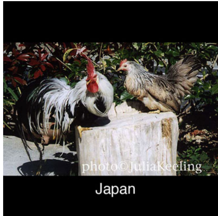
Boven: Ohiki in Japan.

De Japanse bewoordingen en terminologie zijn later gebruikt om de rassen te benoemen. Dit maakt het voor westerlingen verwarrend als deze namen worden vertaald. Ze worden in Japan ' Minohiki-chabo ' genoemd, hetgeen betekent: minohiki = slepend(e) zadel(veren) en chabo = dwerghoen of Japans dwerghoen.