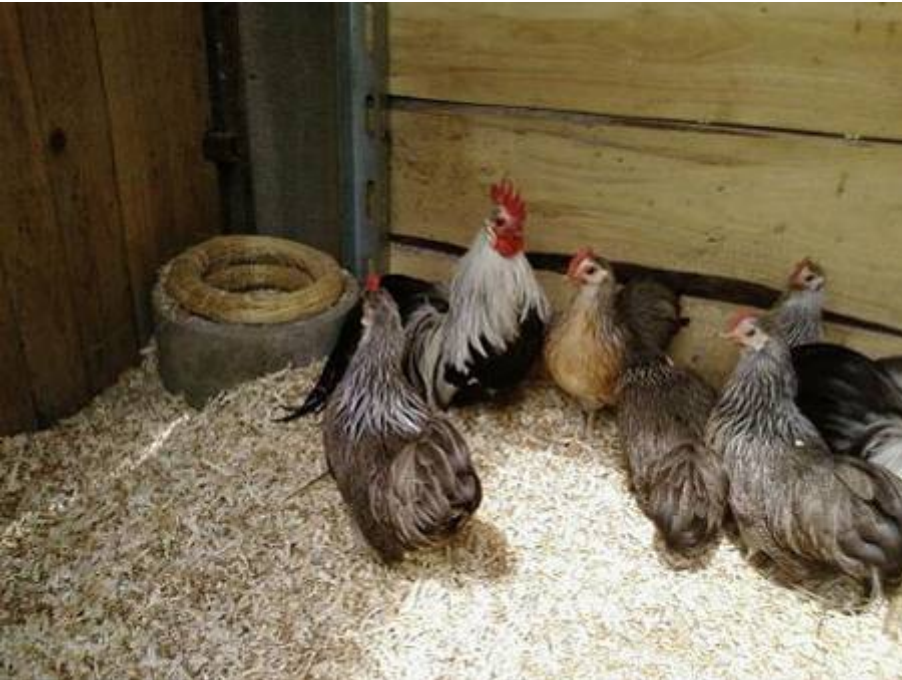
Links: Een Ohiki-toom bij Tamas Molnar, Hongarije.