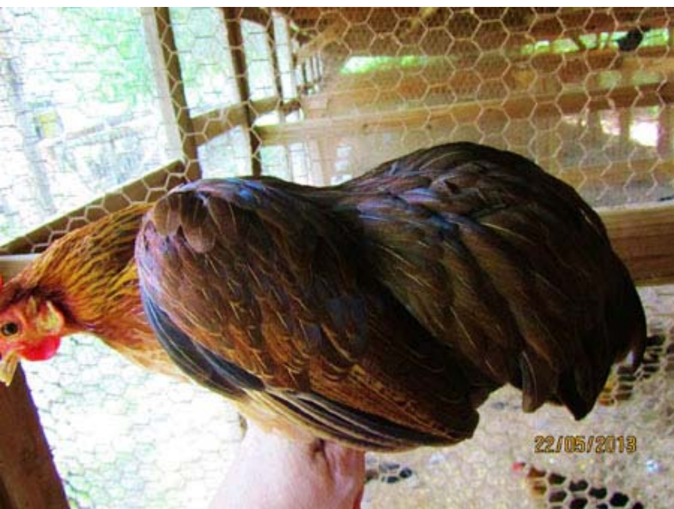
Links: Eén van Toni-Marie's Ohiki hennen. Let op het typisch rijkelijk bevederde zadel.

beginnen maar haar fokkerskunde heeft haar zover gebracht dat ze de Ohiki's in diverse kleurslagen kon verspreiden over fokkers in de gehele VS.