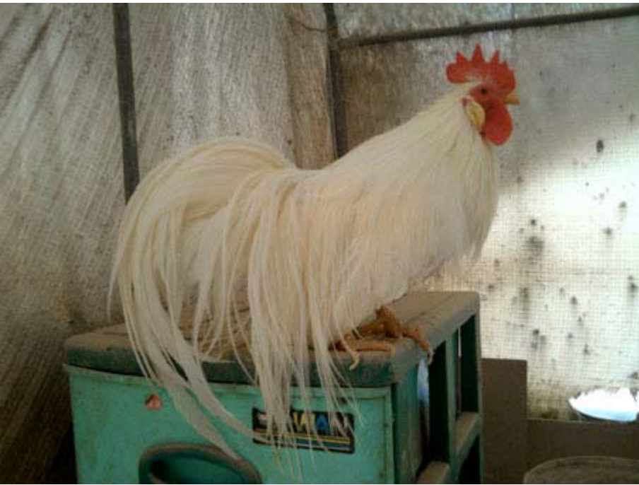
Links: Ohiki in Korea. Fokker en fotograaf: Seong Woon Lee.

Als we ze zorgvuldig bekijken zien we verschillen in type tussen de moderne Chabo en de Ohiki. De Chabo brengt zowel langbenige als kortpotige nakomelingen voort; de Ohiki brengt alleen kuikens met de juiste pootlengte voort.