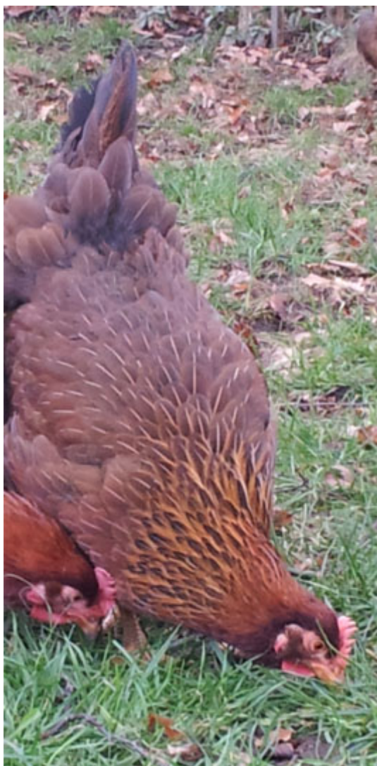
Links onder: Engelse nut - Welsumer hennen met weinig pepering.