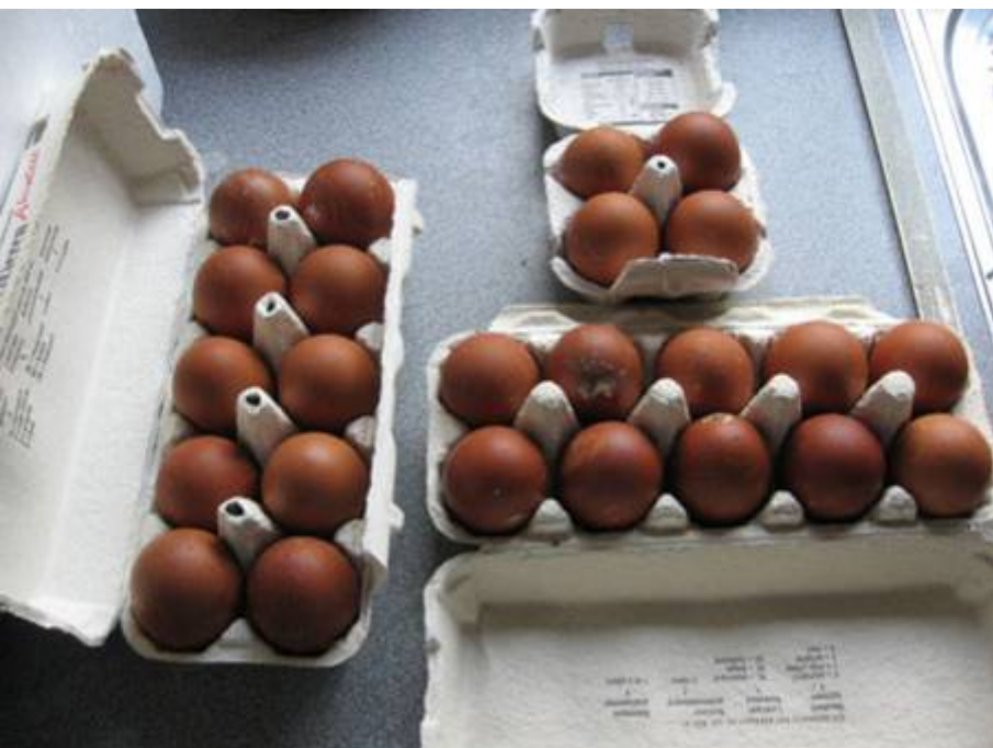
Links: Engelse Nut Welsumer eieren.

wogen zelfs meer dan 80 gram! Op onze laatst gehouden clubdag van de Welsumerclub haalden de meeste eieren van de grote Welsumer nauwelijks het minimale gewicht van 60 gram.