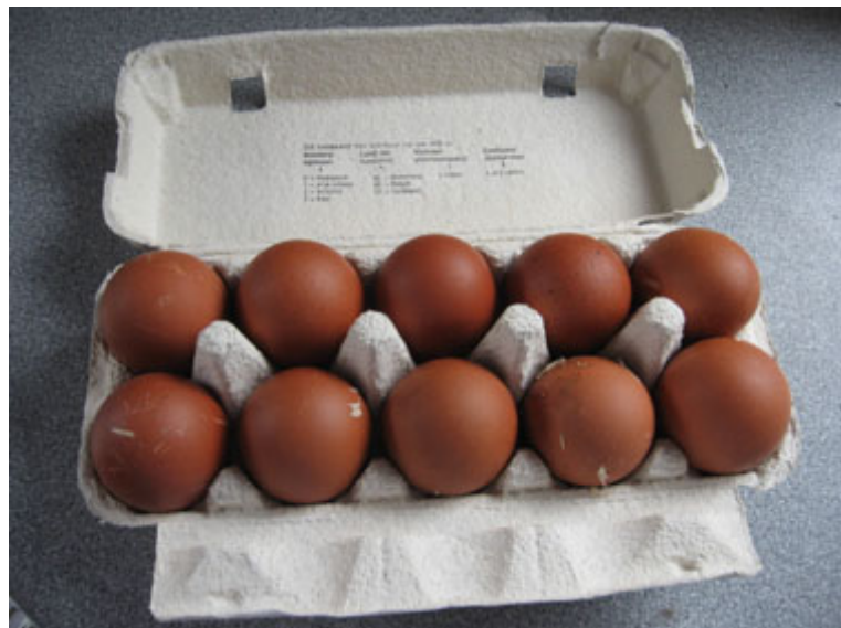
Boven: Nederlandse Welsumer eieren (l) en Engelse nut-Welsumer eieren (r).

Het is nu 2012 en de tweede generatie Engelse nut-Welsumers bevolken al weer mijn hokken. Ik selecteer de broedeieren streng op vorm, gewicht, schaalkwaliteit en kleur. Omdat veel eieren wel een donkerbruine schaalkleur hebben, maar toch nog vaak de mooie spikkels missen, heb ik dit jaar een Engelse haan gekruist met hennen uit een Nederlandse stam die gespikkelde eieren leggen. In het najaar, als de hennen van deze kruising gaan leggen, kan ik hiervan de eerste resultaten zien.