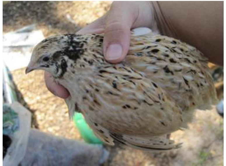
Links: Texas A & M Coturnix.