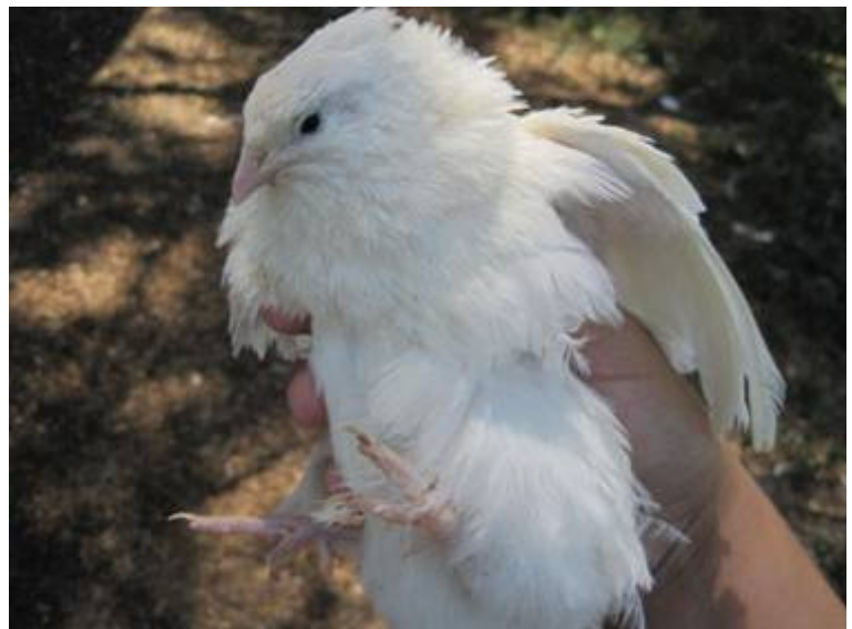
Rechts: English White Coturnix.