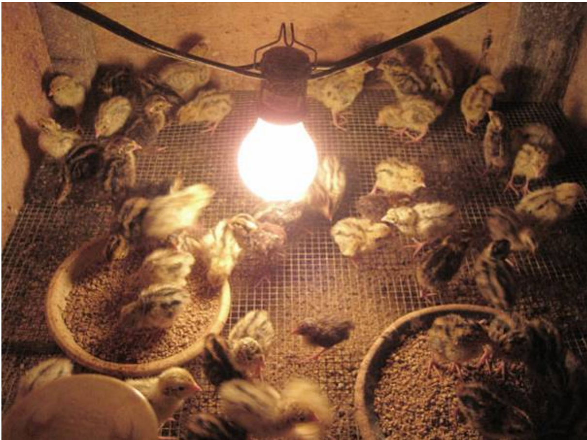
Boven: Voorbeeld van een opfokruimte.