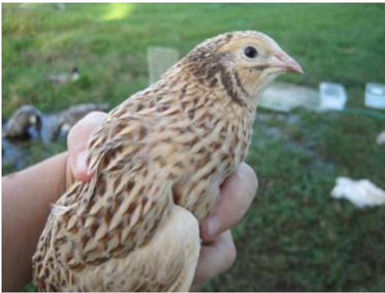
Links: Autumn Amber.