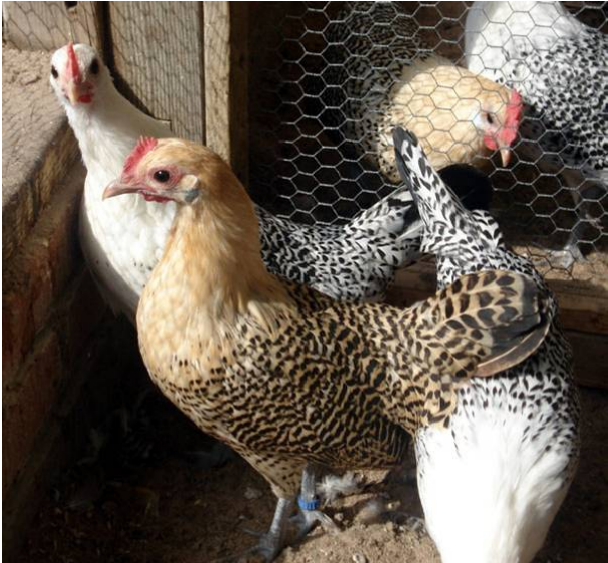
Boven: Jonge hennetjes van 2012, zilverpel en citroenpel.

Tot nu toe heb ik geen enkel probleem gehad om mijn overtollige krielen kwijt te raken. Via Marktplaats, en een bordje in de tuin, is voldoende. Verder is er tijdens tentoonstellingen bijna altijd vraag”.