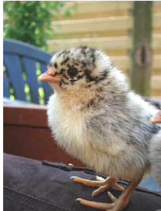
Boven: Groninger Meeuw kriel kuiken.

Groninger Meeuwen sterk op de Oost-Friese Meeuwen (een Duits ras; Oost-Friesland is een gebied aan de Duitse Noordzeekust) maar ook wel op de Friese Hoenders. Meestal werden de pelhoenders genoemd naar de streek, zoals Drentse Hoenders, Hollandse hoenders of Assendelftse hoenders. Waarom nu juist die twee rassen uit de noordelijkste provincies de toevoeging 'Meeuw' kregen, blijft een raadsel, hoewel in oude geschriften wel gesuggereerd wordt dat ze zo genoemd werden omdat de kuikens van de zilverpellen er net zo uitzien als de kuikens van de zilvermeeuw. En zilvermeeuwen zijn in die noordelijke kustgebieden heel algemene broedvogels.