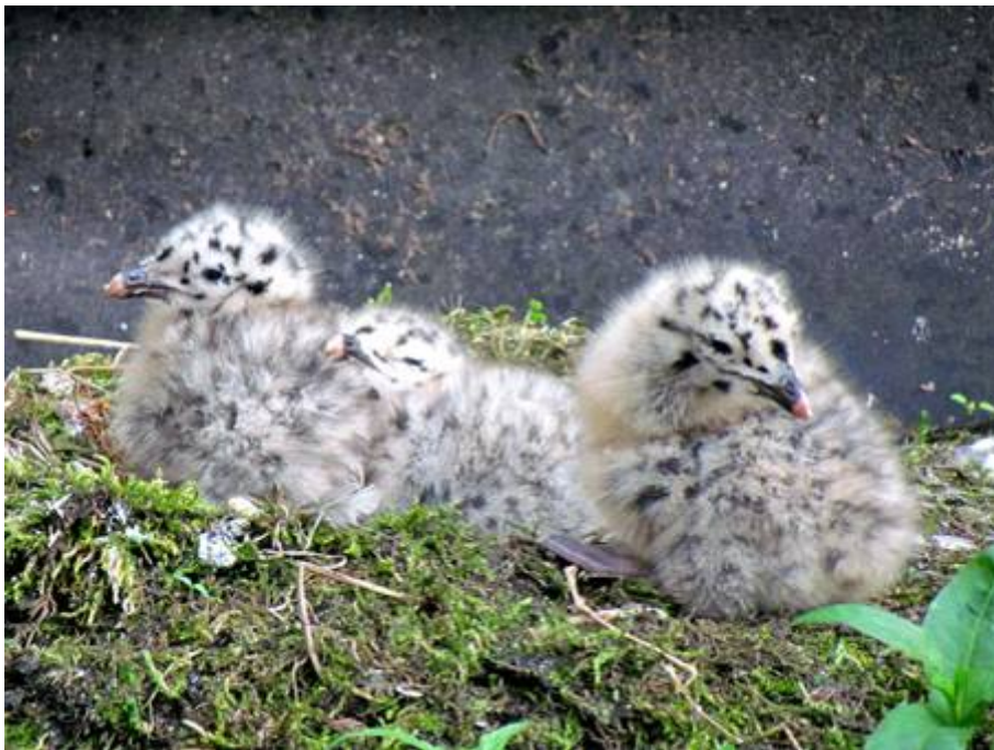
Links: Kuikens van de zilvermeeuw.