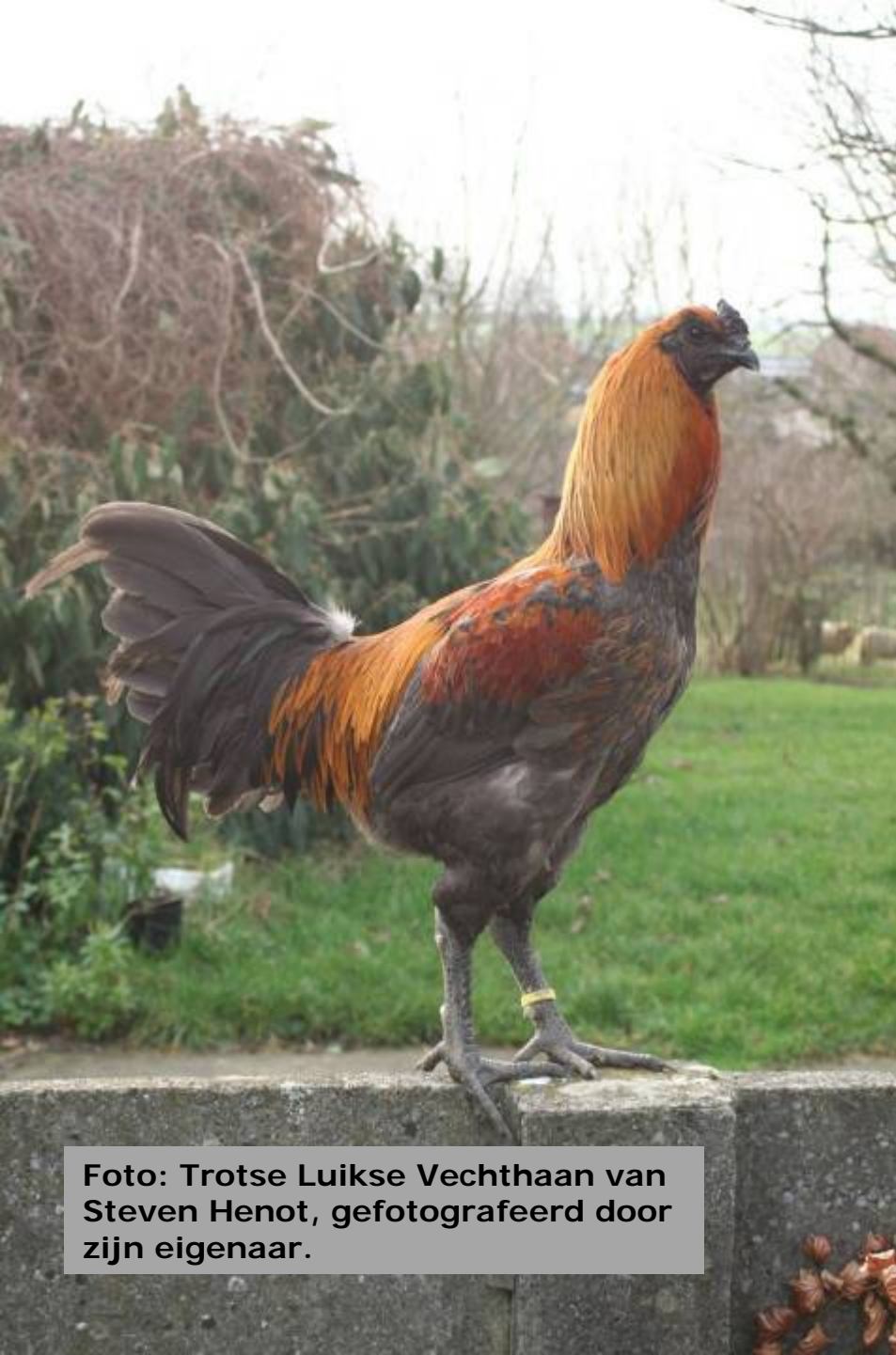
Foto: Trotse Luikse Vechthaan van Steven Henot, gefotografeerd door zijn eigenaar.