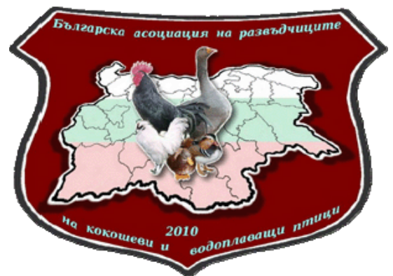
Boven: Banner BAPB. Links: Zwarte Shumen hen.