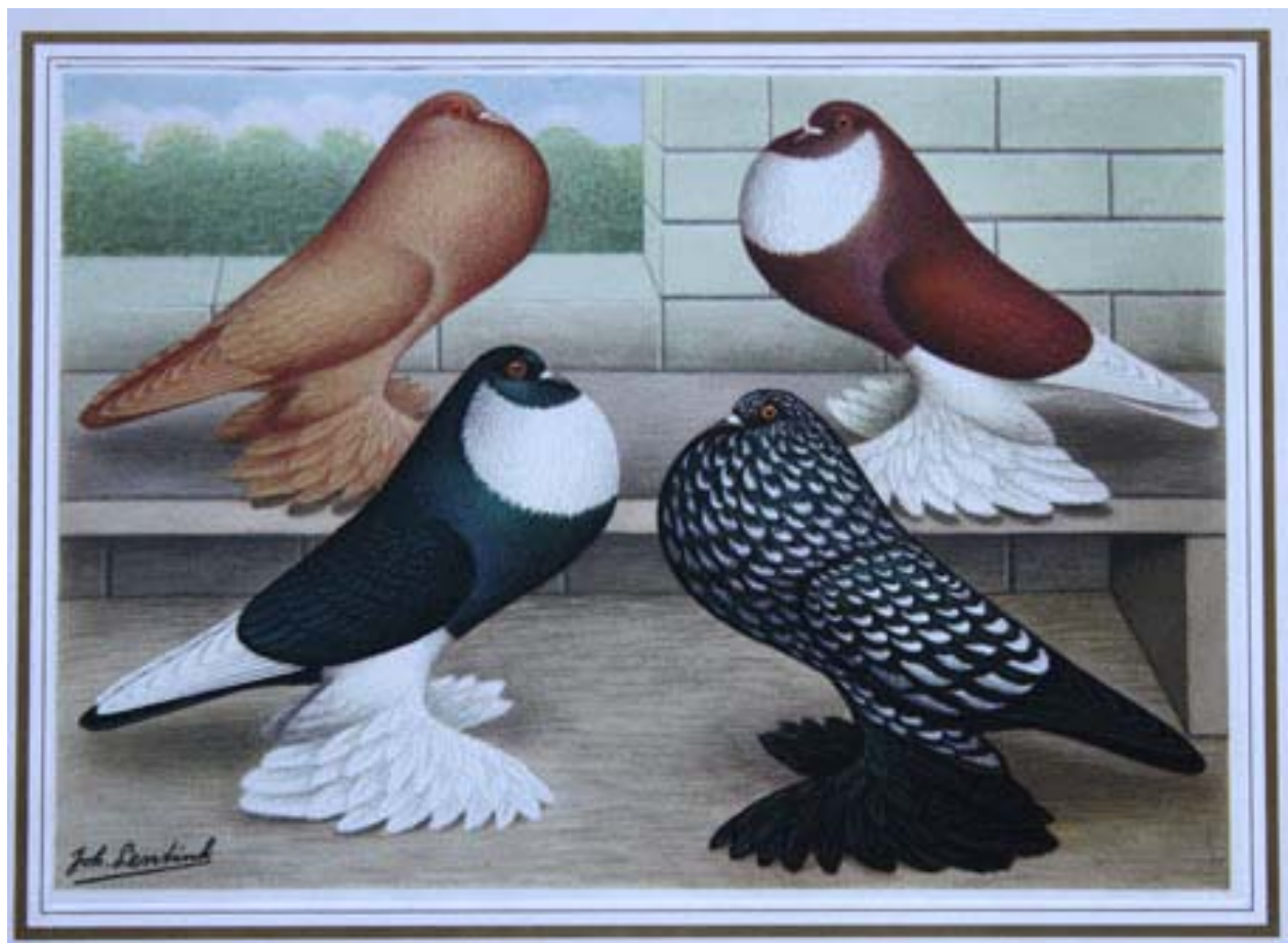
Boven: Een zelfde plaat van Joh. Lentink staat afgebeeld in het boek "Onze Duivenrassen in woord en beeld" van C.A.M. Spruijt uit 1954. Van links boven naar rechts onder: Eenkleurig geel, rood bont, zwart bont en donkergetijgerd.

Dankzij die verwantschap heeft men een aantal malen kunnen teruggrijpen naar die andere rassen, wanneer een van de rassen hierboven genoemd in de verdrukking dreigde te raken, zoals in de tijd direct na de tweede wereldoorlog, toen over en weer Hollandse- en Gentse Kroppers werden gebruikt om het eigen ras weer op niveau terug te brengen. Zo werden er ook Pommerse- en Engelse Kroppers gebruikt. Dit alles had wel tot gevolg dat soms jaren later er plotseling uit een stam Hollandse Kroppers, een perfecte Pommerse Kropper werd geboren. Dit gebeurde o.a. bij Jac. Beljaars, de bekende Hollandse Kropperfokker uit de omgeving van Best, die na acht jaar een Pommerse Kropper terugfokte.