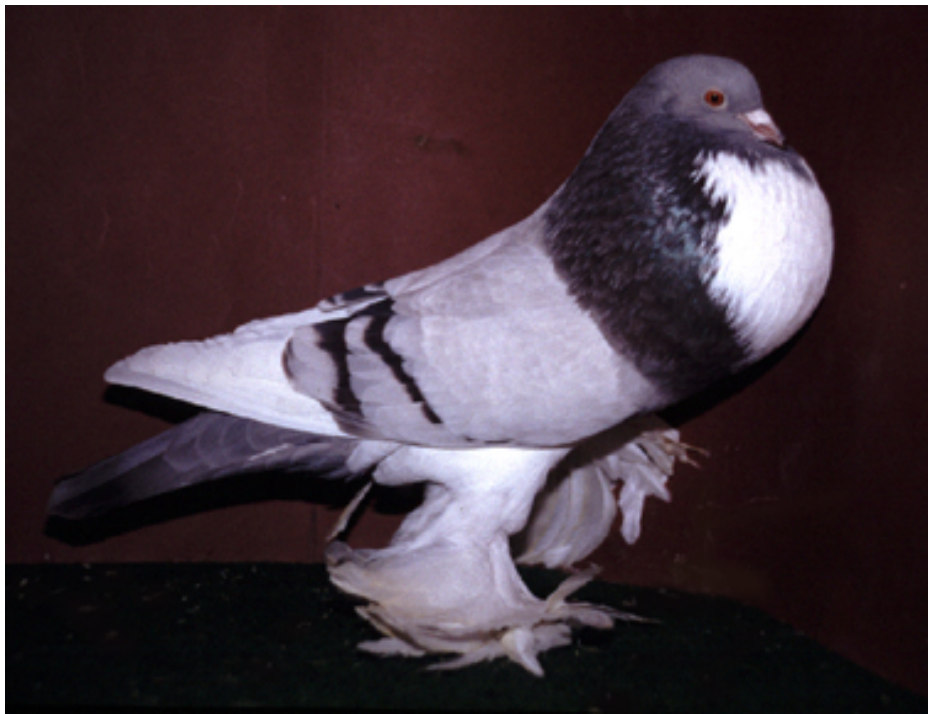
Links: Blauwzilver donkergebant bont v/o. Behaalde 96 punten op de EZHSV-show van 2006 Inzender: M. Struik

De verwantschap tussen de diverse grote Kropperrassen is dus duidelijk. Dat wil zeggen, met name tussen de Hollandse-, Gentse-, Pommerse-, Engelse-, Franse- en Saksische Kropper is een sterke overeenkomst in een aantal hoofdrassenmerken. We hebben het hier echt over de stamvaders van alle huidige kropperrassen; oerrassen die tenminste al 400 jaar in Europa voorkomen.