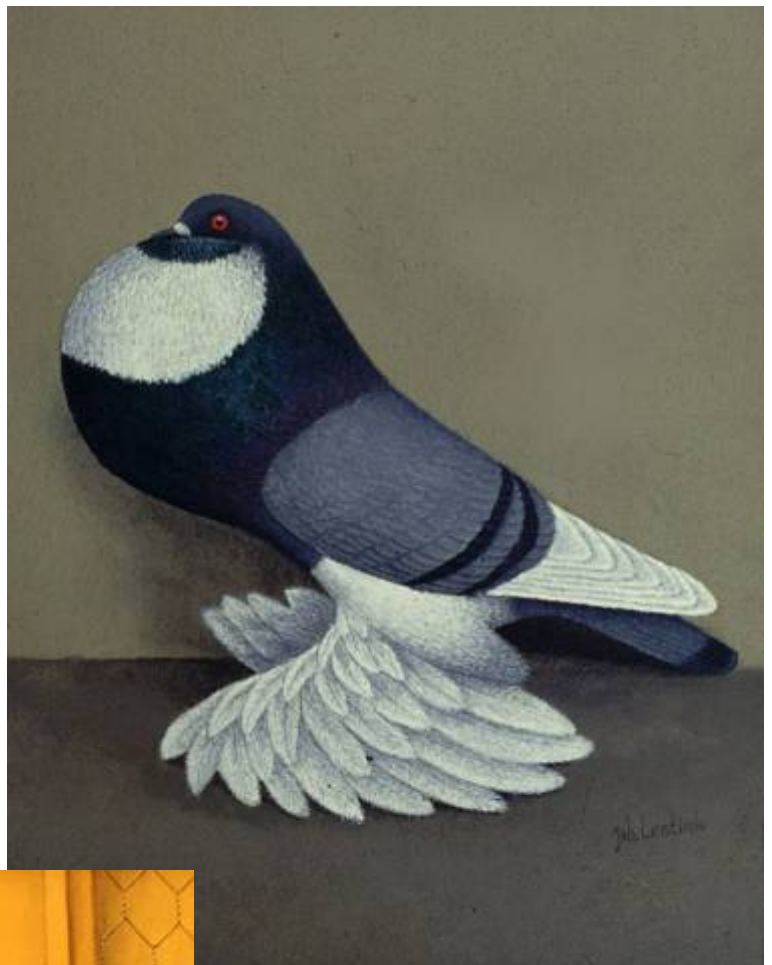
Boven: Olieverf schilderij van Joh. Lentink.

Zoals C.A.M. Spruijt in zijn boek 'De Kroperrassen' van 1929 beschrijft, is de herkomst van de Hollandse Kropper niet geheel duidelijk. De verwijzing die hij maakt is die, zoals velen reeds deden: hij verwijst naar Ulyssis Aldrovandi (1522-1605), die in het jaar 1600 schreef over de grote koppers met voetbevedering bij de Bataveren. De Engelse literatuur vermeldt dat de Engelse koppers uit Holland kwamen en in Duitsland beschrijft Neumeester de koppers in zijn eerste boek van 1837. Dit boek werd in 1876 opnieuw uitgegeven, aangepast door Prütz en voorzien van kleurenafbeeldingen waaronder een aantal duidelijk herkenbare Duitse voetbevederde Kroperrassen, die hij: 'Hollandische Kropf Tauben' noemde.