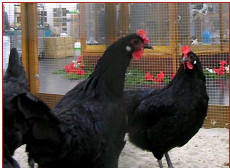
Augsburger Buttercups.