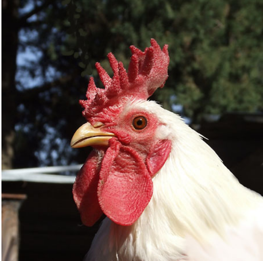
Boven: Een witte Siciliana haan.

Amerikaanse, Engelse en Nederlandse fokkers hebben misschien gehoord van, of zijn wellicht bekend met het Siciliaanse Bekerkamhoen . Een zeldzaam ras, dat af en toe wordt gezien op shows. Echter, dit is niet hetzelfde ras dat de Italianen Siciliana noemen, en afkomstig is van Sicilië. Sterker nog, er zijn nóg een paar rassen van bekerkamhoenders wereldwijd, die al gauw tot verwarring leiden.