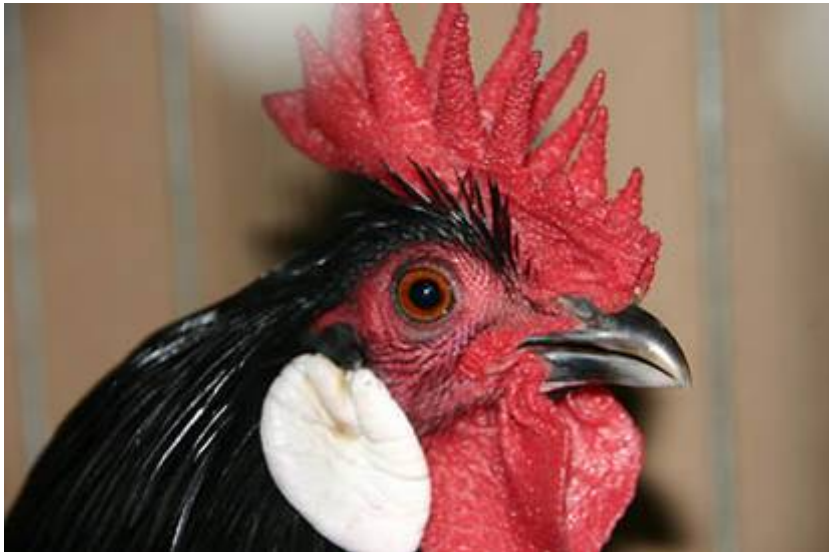
Links: Augsburgse Buttercup, krielhaan.

De Augsburgse Bekerhammen zijn (in Duitsland) ook erkend in dwergvorm.