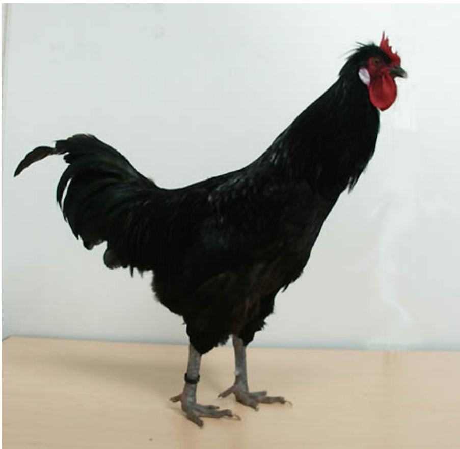
Boven en links: Caumont haan; een zeldzaam Frans bekerhamras.

Het kwam in de Franse standaard in 1913. Het ras verdween later en thans worden weer pogingen ondernomen om het ras volgens de standaard te herscheppen. De Caumont bestaat alleen in zwart. De haan weegt minimaal 3 kg.