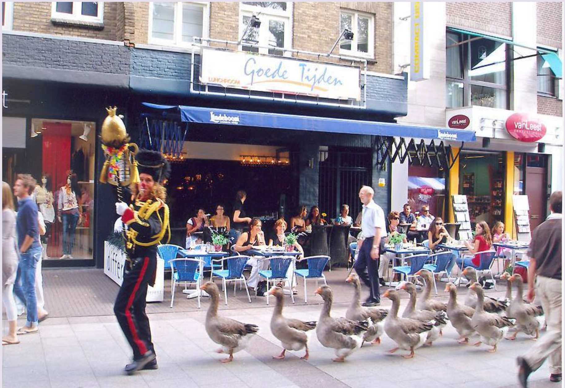
GANZENPARADE IN MAASTRICHT