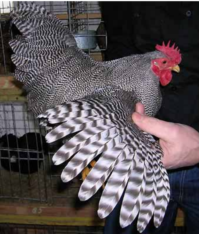
Gestreepte haan (boven) en hen (rechts). Onder: Een buff hennetje.