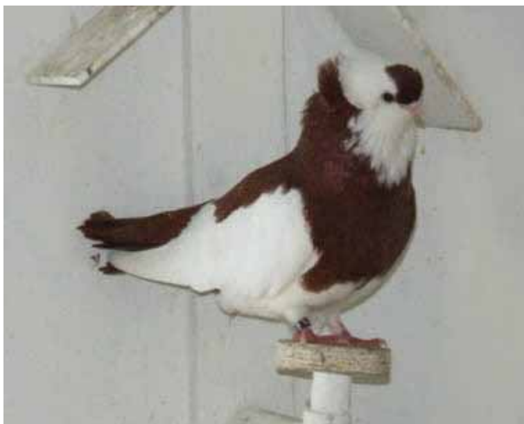
Links: Een Felegyhaser Tuimelaar rood; een mooi type en bijna perfect getekend.