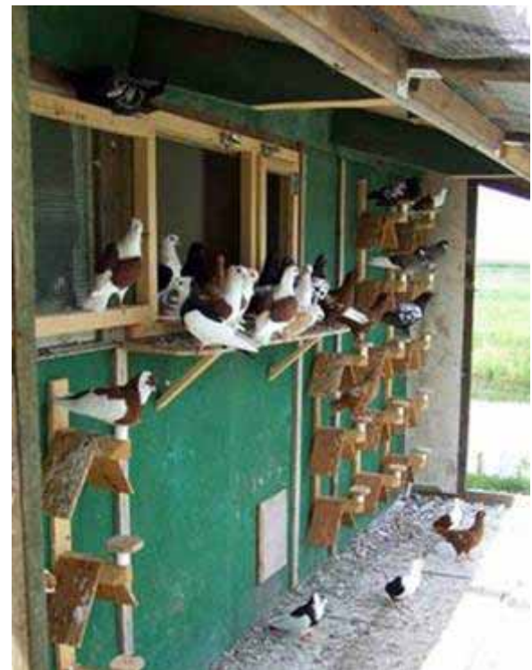
Rechts: Weer een van de volières, met steeds meer duiven en nieuwe rassen. Hier zien we o.a. op de voorgrond een Felegyhaser Tuimelaar.