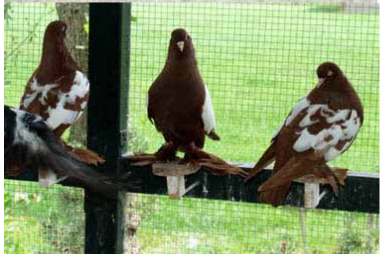
Rechts: Oud Hollandse Tuimelaars in rood schildgetijgerd, hier in de volière van Cor Meijer.