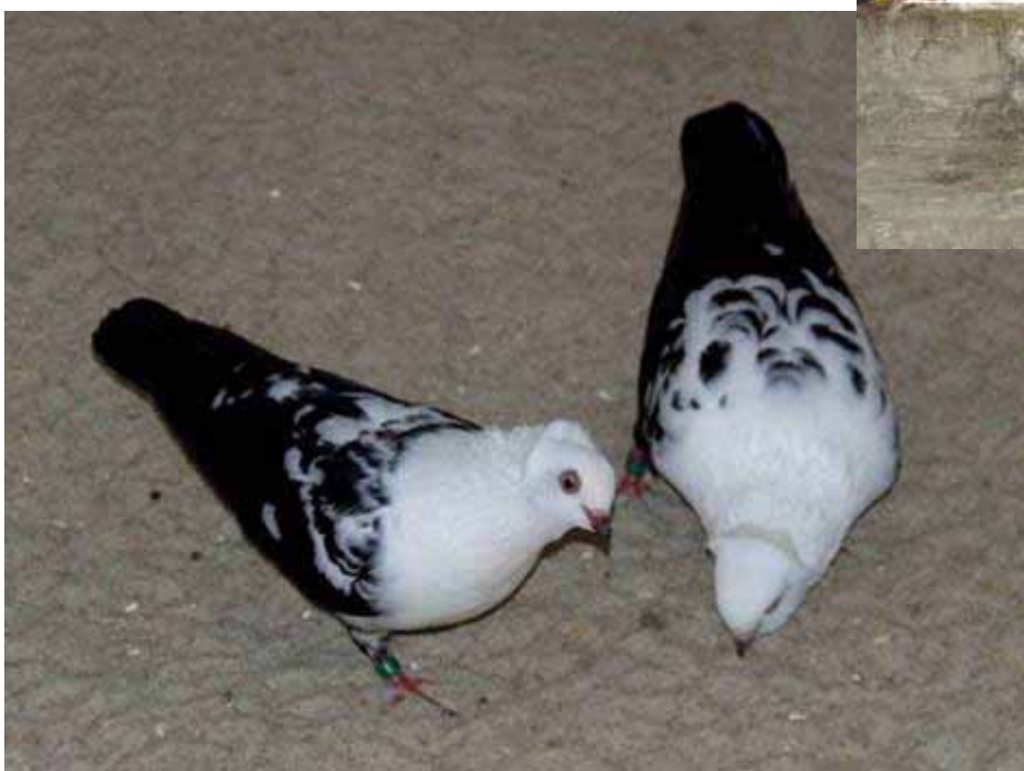
Links: Een koppel fraai getekende en mooi intensief zwart gekleurde Timisoara Tuimelaars.