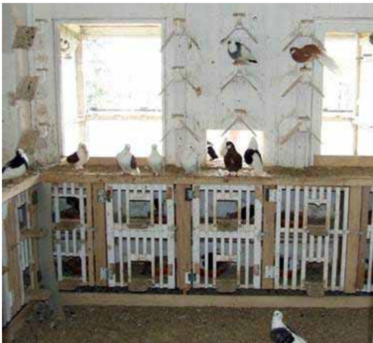
Links en onder: Dit zijn de duivenhokken van z'n zoon, waarin diverse rassen, zoals: Oud Hollandse Meeuw, Amsterdamse Baardtuumelaar, Timisoara's (vroeger Temeschburger Schecke), Nederlandse Hoogvlieger en Gentse Kroppers.