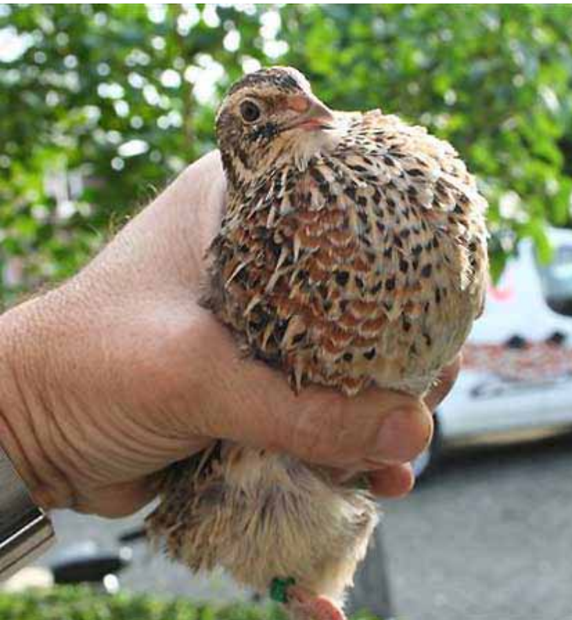
Links: Andere kwartelsoorten zijn schuwer en kunt u beter op deze manier vasthouden, om veerverlies te voorkomen.