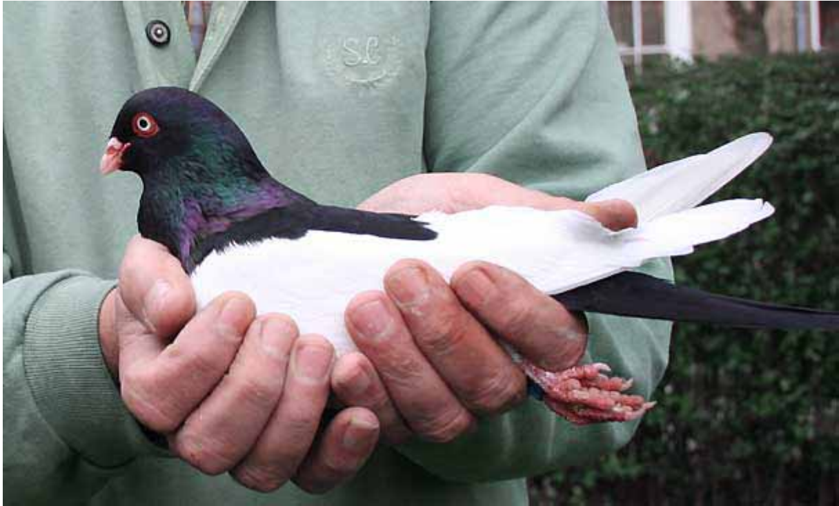
Boven: De juiste manier om een duif vast te houden.

Tropische duiven moeten zo mogelijk met een schepnetje gevangen worden, omdat hun verenpakje 'los' zit en als u ze zo maar met de hand zou grijpen, zou dat een groot veerverlies tot gevolg hebben. Dit geldt ook voor de meeste kwartelsoorten. Japanse kwartels zijn wel gewoon op te pakken, zonder dat de veren in het rond vliegen.