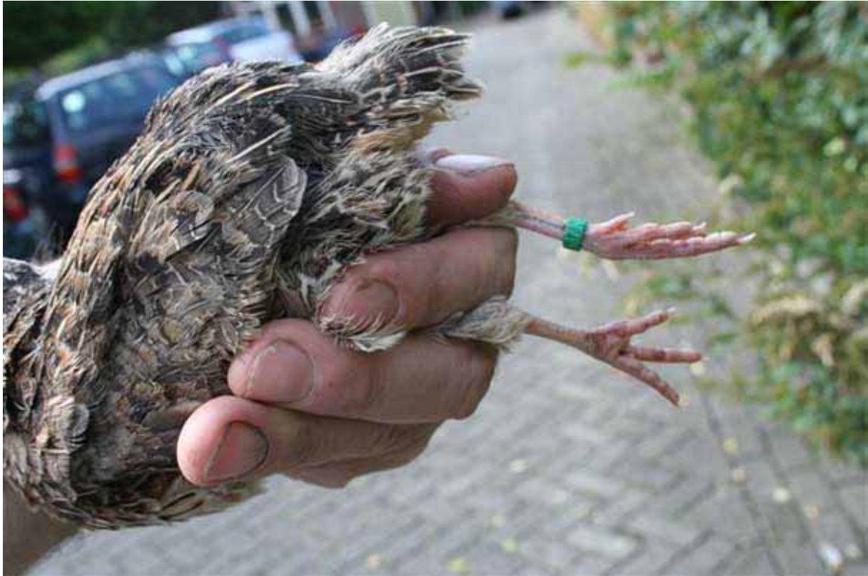
Boven: Hier kunt u goed zien hoe de pootjes van Japanse kwartel vastgehouden kunnen worden.