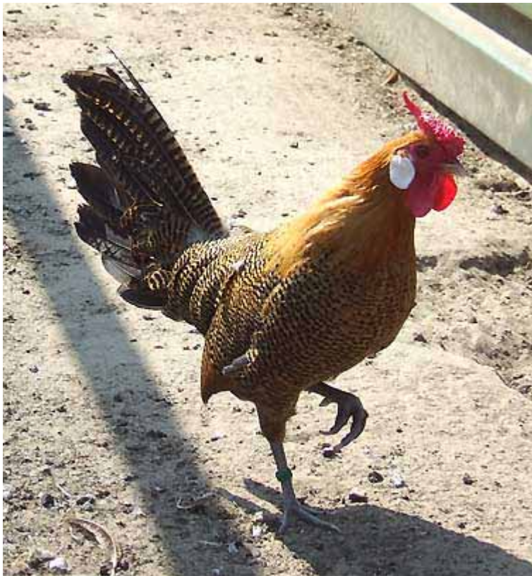
Links: Goudpel Hollands Hoen, hennevederige haan.