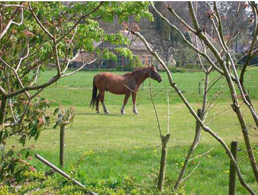
Links: Het Gelderse paard. Rechts onder: De koets.