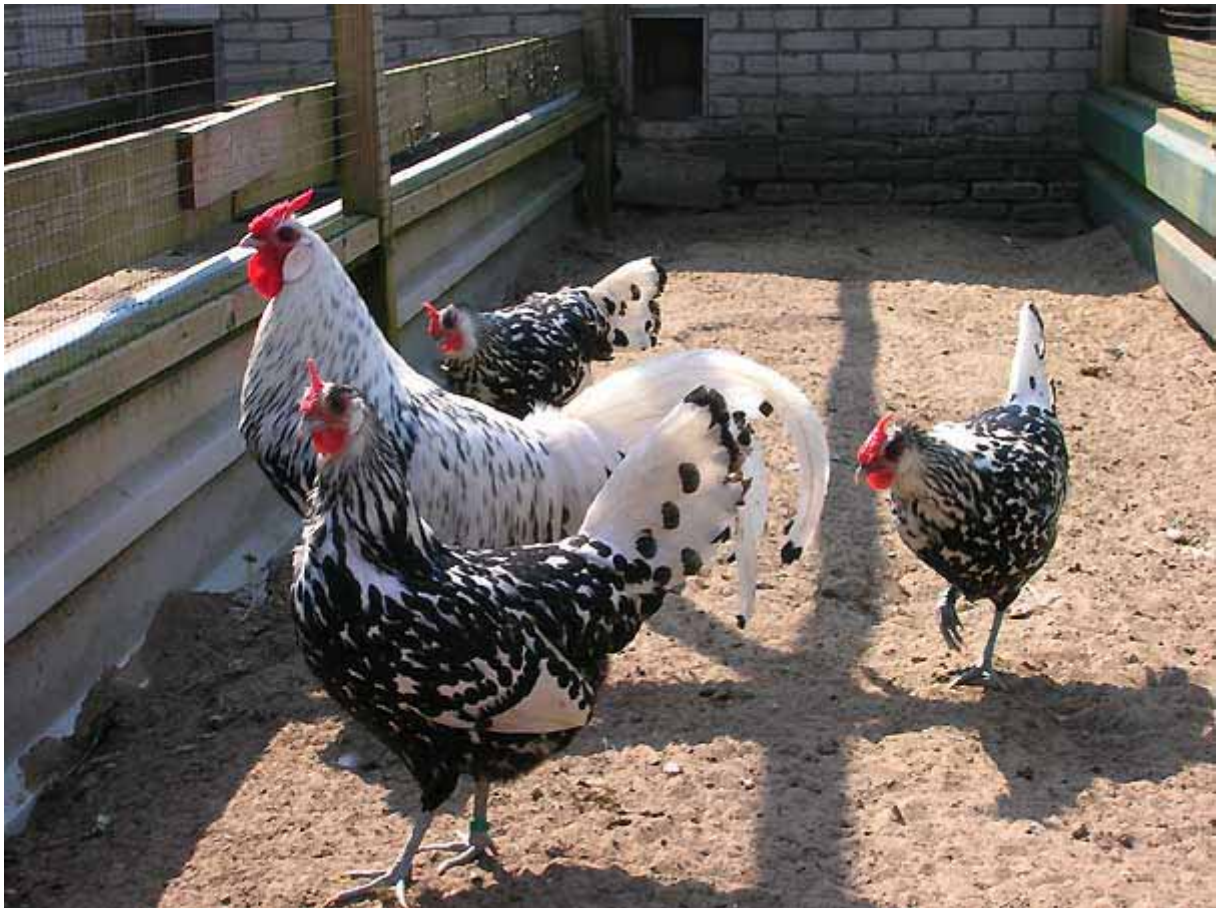
Boven: Toom zilver zwartgeloverde Hollandse Hoenders.