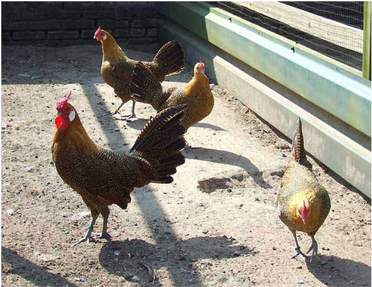
Boven: Toom goudpel Hollandse Hoenders, met hennevederige haan.