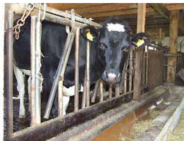
Links: Een van de vaarzen.