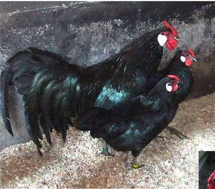
Links: Zwarte Hollandse Hoenders. Rechts onder: Zilver zwart- geloverde Hollandse Hoenders.