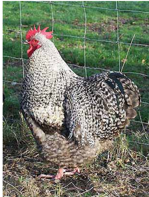
Boven: Gestreepte Orpingtons in Nederland. Fokker/fotograaf: Henk Sanders.

Deze kleurslag overleefde de eerste Wereldoorlog niet, dus de huidige koekoek of gestreepte Orpingtons zijn opnieuw gecreëerd en in ieder geval in Duitsland in een zeer behoorlijke kwaliteit aanwezig. Ook in Nederland lopen er hier en daar een paar rond, en zelfs in Engeland worden weer ze sporadisch gezien. De oogkleur van de gestreepte Orpingtons is bruinrood, de snavel en de poten zijn wit.