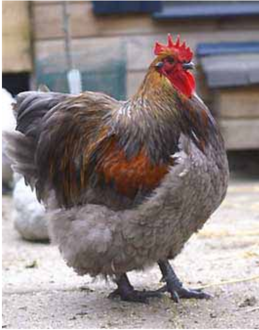
Links: Blauwpatrijs. Foto/fokker: José Kramer. Onder: Geelkoekoek. Fokker/foto: Bob Follows.