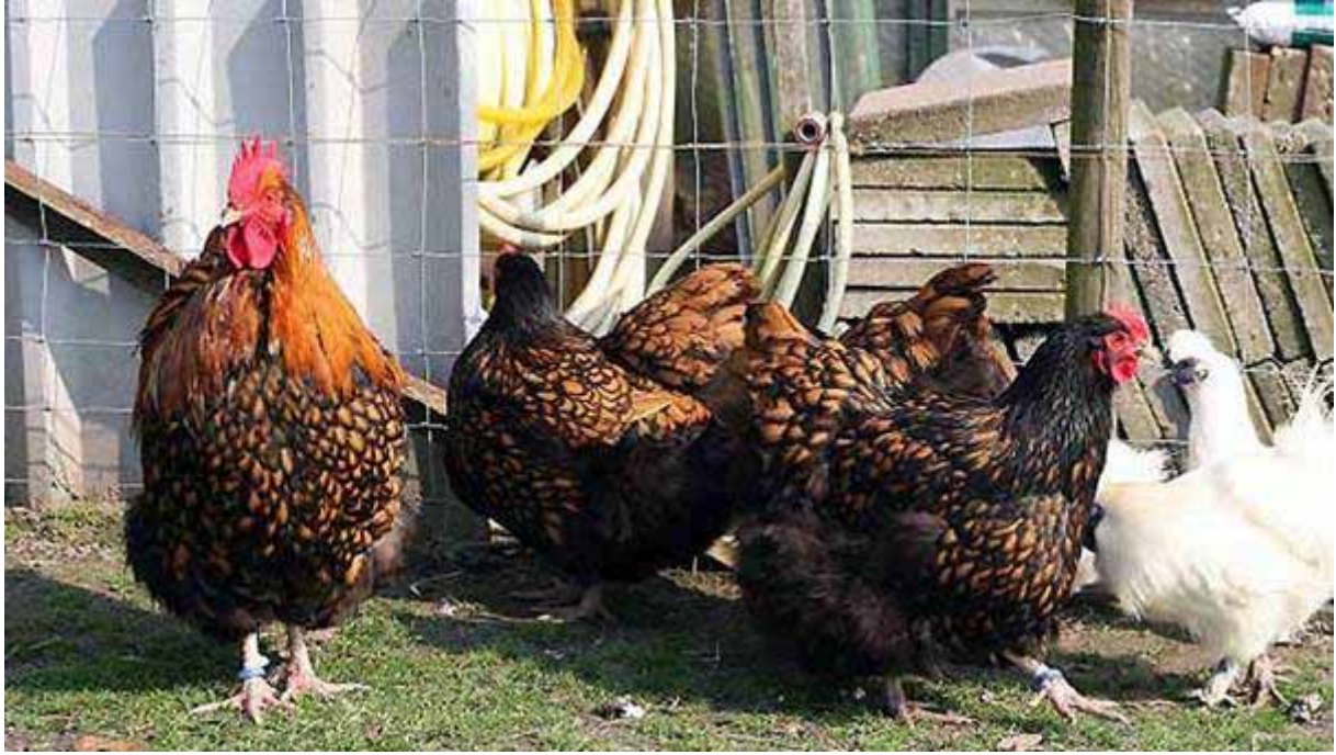
Boven: Toom goudgeel zwartgezoomd. Fokker en fotograaf: Andros Vijge (NL).

DEEL 2: DE OVERIGE KLEURSLAGEN. Door: Elly Vogelaar