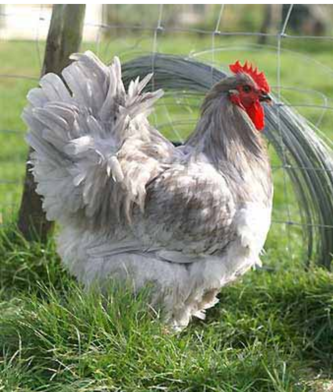
Links: Parelgrijs bij Priscilla Midleton.

wordt in Engeland en Nederland al op grote schaal gefokt. Het is een tere grijsblauwe tint, die vooral verschilt van de blauwe kleurslag doordat halsbehang van de hen en sierveren van de haan dezelfde parelgrijze tint hebben als de rest van het gevederte. Ook zijn de veren niet donker omzoomd.