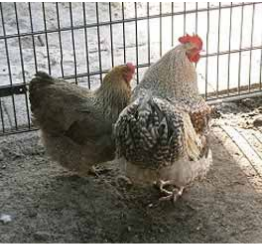
Boven en rechts: Koekoekpatrijs Orpingtons van Deense origine. Fokker en fotograaf: Wiljan Becker.