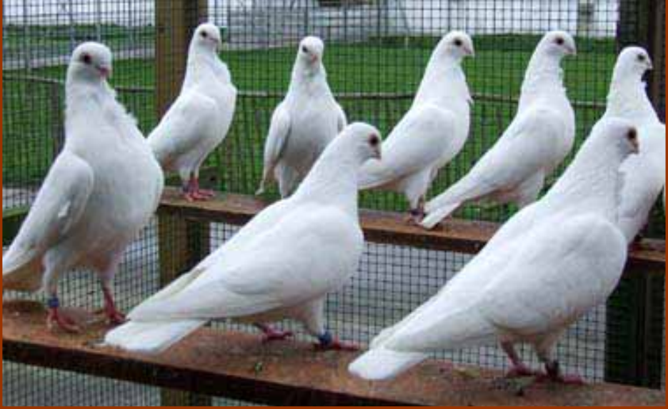
Links: Jonge witte Figurita's na het broedseizoen in de volière van Ad van Bente. Er moet nog geselecteerd worden, maar de klasse haal je er nu al uit.