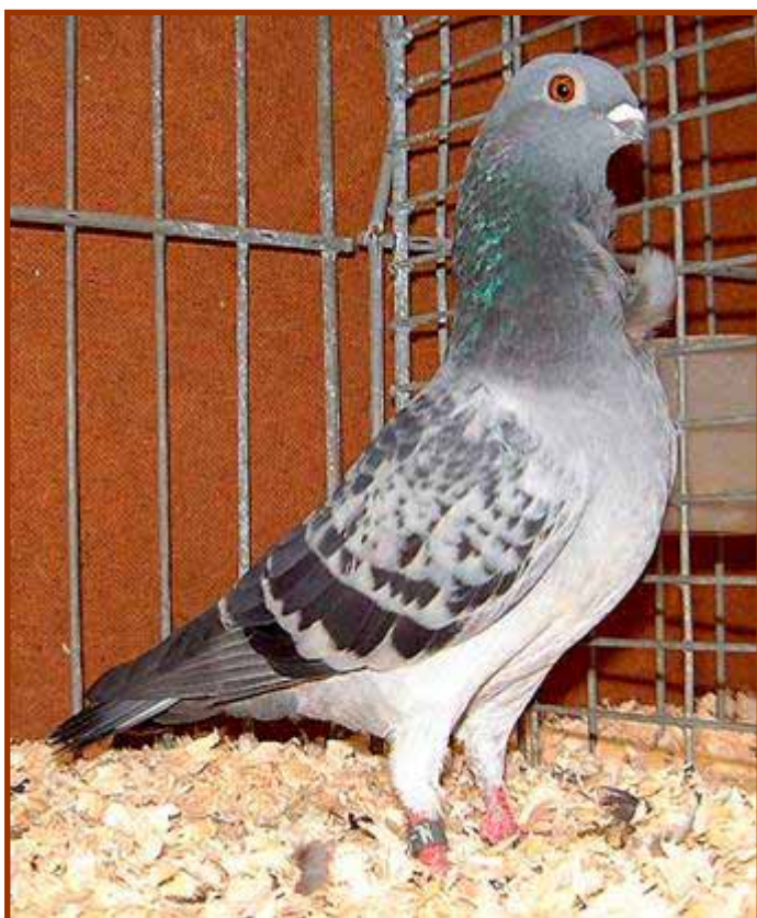
Links: Blauwzwartgekraste Figurita, met een perfect type en stand. En natuurlijk kon de krastekening nog iets beter.

*) De Smoky factor bij blauw geeft een 'aangeslagen' tot lichtere snavelkleur, verder is het blauw donkerder met een min of meer gewolkte donkere tekening op de vleugelschilden, waarbij de vleugelbanden minder smal en strak zullen zijn.