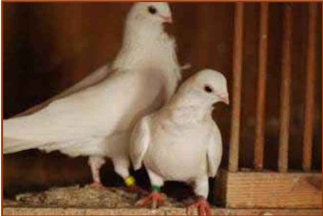
Onder: In de paartijd zal de doffer zijn duivin weinig rust gunnen, hij zal haar blijven opjagen, tot de eieren gelegd zijn.