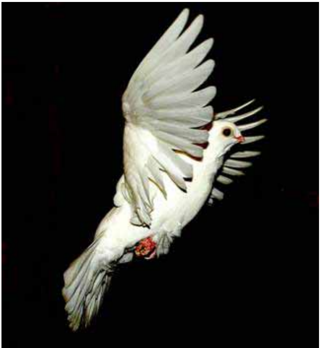
Links: Uiteindelijk vliegen alle Figurita's als ze volwassen zijn, zo zelfverzekerd rond.