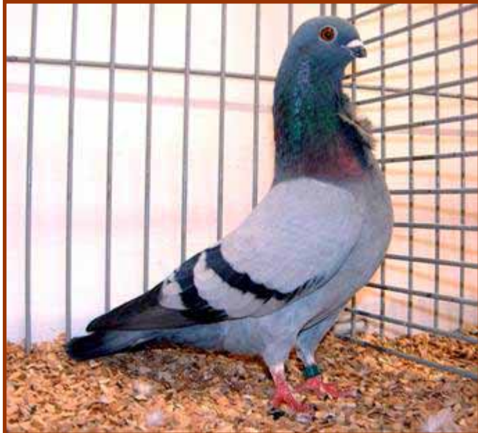
Links: Blauwzwartgebande Figurita.

Benen: in verhouding middellang, zowel onbevederd als bekousd, maar dan wel zonder gierhakken. In actie staat de duif op de voorste tenen. De bekousing betreft bevederde loopbenen, waarbij de tenen juist bedekt worden.