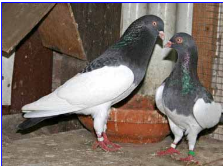
Links: Een stel Oud-Duitse Ekstertuimelaars in blauw gekrast waarbij duidelijk de (toegestane) iets donker aangeslagen snavel zichtbaar is.