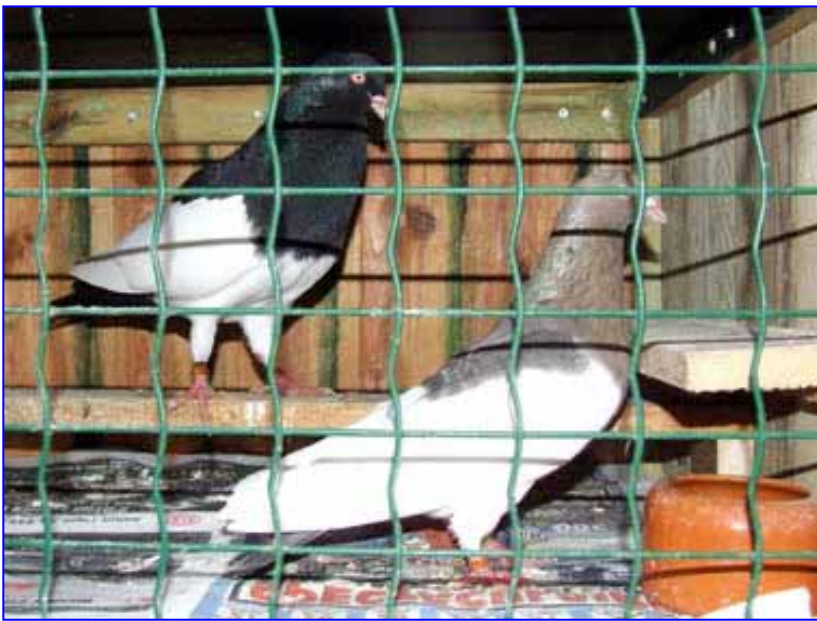
Links: Koppel Oud-Duitse Ekstertuimelaars hier in een afzonderlijk broedhok

Ondertussen is ook hij overtuigd van de vruchtbaarheid en de kweeklust van het ras; de doffers zijn gek op vooral de jonge duivinnen die ze zelfs tijdens het eten aan de voerbak proberen te paren. Het is een ras wat met gemak zeven fokrondes per jaar met 14 jongen kan opleveren. Het is zeker geen schuw ras op het hok, wel beweeglijk. Daarbij kan er tijdens het broeden enige agressiviteit naar de burens ontstaan; ze hebben dan kennelijk toch wat meer behoefte aan enig territorium. Dat is dan ook de reden