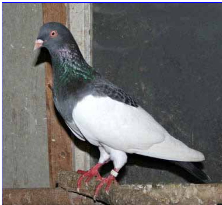
vormt een strakke lijn met de snavel, wat ongewenst is.

Rechts: Blauwgekraste Oud-Duitse Ekstertuimelaar, die hier een mooie krastekening in het hart laat zien. Helaas toont deze duif onvoldoende voorhoofd. Het voorhoofd