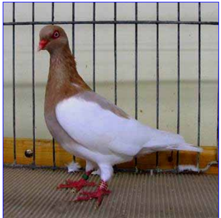
Links: Aszilverkleurige Oud-Duitse Ekstertuimelaar met donkerkleurige snavel en donkere oogranden.