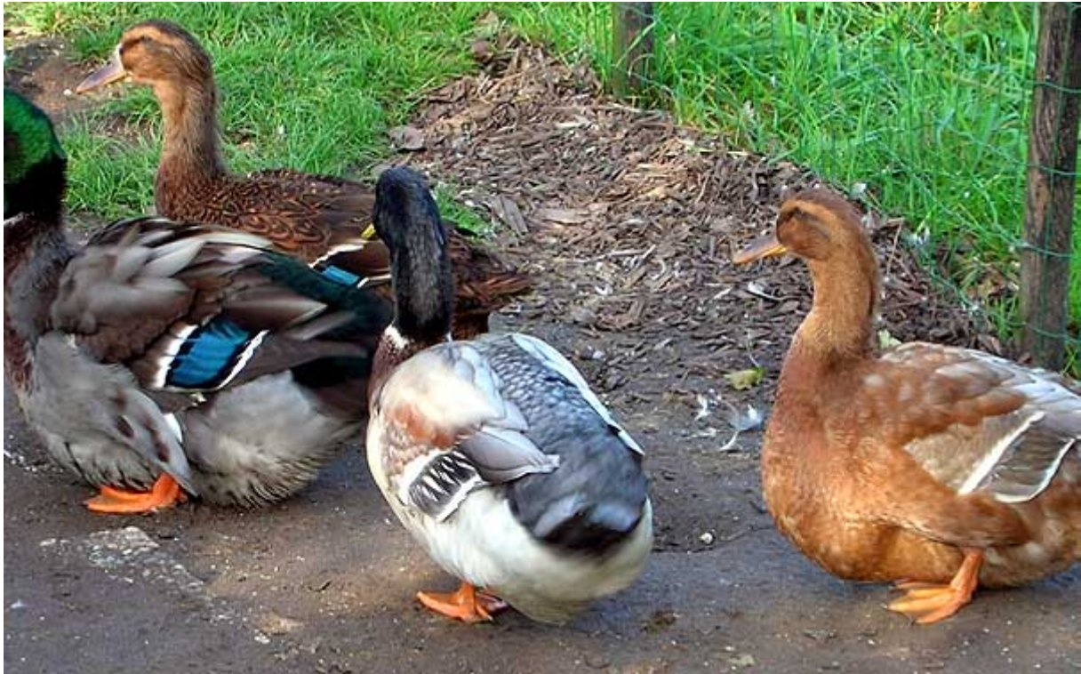
Boven: In de voorgrond een paar Rouaan eenden in de blauw-wildkleur.

Al in 1874 werd de Rouen eend in de Amerikaanse standaard opgenomen. Men heeft daar een 'productietype', wat nog redelijk op de Franse Rouen lijkt (2.7–3.6 kg) en een zwaarder, vierkanter 'tentoonstellingstype' (4.1–5.4 kg).