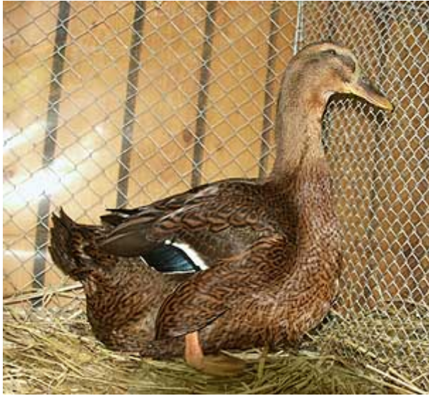
Links: Rouaan Engels type, eend.

groenachtige eierschaal met lichtere of blauwachtige nuances.