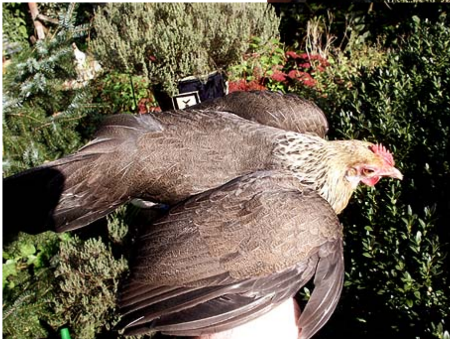
Boven en links: geelpatrijs hennetje.

Het zijn vitale, actieve krielen. De leg is heel goed en voor zo'n kleine kip een mooi formaat ei. Als ze een vrije uitloop hebben, zijn ze altijd ijverig in de weer, maar u moet er wel rekening mee houden dat ze ook goed kunnen vliegen.