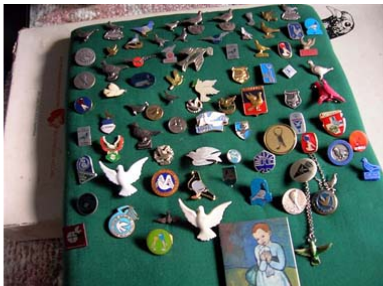
Links: De verzameling duivenspeldjes, keurig gerangschikt en bij alles hoorde een verhaal.

Boven gekomen troffen we een geweldige collectie sierduivenboeken aan, maar ook meerdere verzamelingen op duivengebied, zoals visitekaartjes, speldjes, theelepeltjes, ansichtkaarten, postzegels, suikerzakjes, sleutelhangers, enz.. enz .. je kon het zo gek niet verzinnen, als er maar een duif op stond.