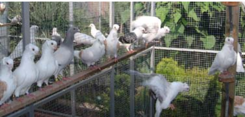
Links: Een verzameling Oud Duitse Meeuwen in de buiten-volière, met ook een Nederlandse Schoonheidspostduif (4 e duif van links).

bonte Nederlandse Schoonheidspostduiven. Die zijn volgens de standaard erkend, maar bestaan niet meer, dus werd een bonte postduif ingekruisd, maar die bracht niet de gewenste bontfactor, maar wel schimmel.