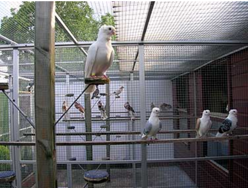
Links: Een doorkijk in de volières, met vooraan de Oud Duitse Meeuwen en achterin de Engelse Dwergkroppers.

In de periode 1970 – 1975 werden Duitse zogenaamde 'super' dieren voor veel geld aan buitenlanders verkocht, die helaas weer de oude foute snavelinplanting lieten zien. Doordat wij inmiddels een aanpaste standaard hadden, kregen die dieren en de afstammelingen ervan lage predikaten op onze shows, waarop de fokkers ze thuis hielden. Pas na 1995 hadden we veel betere dieren beschikbaar, ofschoon de invloed van de oude koppen nog steeds merkbaar is. Zo moet men b.v. zeer alert blijven op de Duitse verkoopbeurzen, waar regelmatig verkeerde dieren worden aangeboden. De problemen worden pas na thuiskomst opgemerkt, waar men na vergelijking met de eigen dieren vaststelt dat de snavelinplanting niet optimaal is en de rozetten aan beide zijden van kap te laag zijn aangezet.