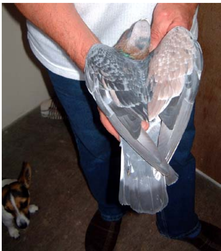
Links: In onze rondgang langs de diverse hokken en volières, bleek er naast het eerder bezochte hok, nog een belangrijke afdeling met Oud Duitse Meeuwen te zijn.

Voor de duidelijkheid: mozaïek moet tot een toevalstreffer in de fokkerij worden gerekend. Waarbij een onlogische kleurencombinatie ontstaat met een willekeurig tekeningspatroon. Het is nog nooit iemand gelukt om dit te reproduceren of bewust te fokken.