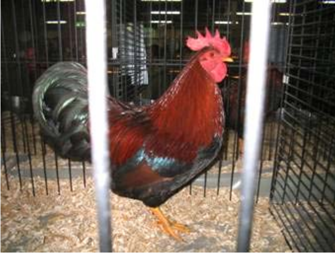
Links: Roodpatrijs krieltaan, Frankrijk. Wat roder dan wij in Nederland wenssen.

De Duitse interpretatie van de kleurslag roodpatrijs wijkt wat af van de Nederlandse. De belangrijkste verschillen zijn de lichte veernerven op rug en vleugels bij de hennen, wat in Duitsland verplicht is maar wij in Nederland niet willen, en de andere borsttekening van de hanen, nl. donskleur grijs, dan een gedeelte bruin en tenslotte een zwarte lover op het veereinde. Verder is de grondkleur wat donkerder rood, vooral bij de krielen, zó erg dat de zwartachtige pepering nauwelijks meer zichtbaar is. Het streven is om op den duur de verschillen tussen de Nederlandse en Duitse Welsumers zo veel mogelijk op te heffen.