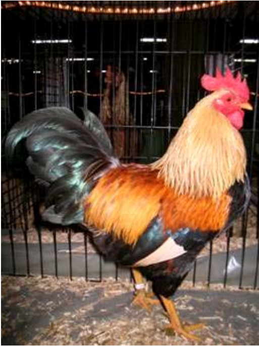
Links: Welsumer krielhaan, geelpatrijs, Frankrijk.

Duitse krielen, Wyandottekrielen en Red krielen. De huidige krielen staan op een hoog peil. Gestreefd wordt naar zo klein als praktisch mogelijk, waarbij de gelijkenis met de grote Welsumer zwaarder weegt dan de afmeting.