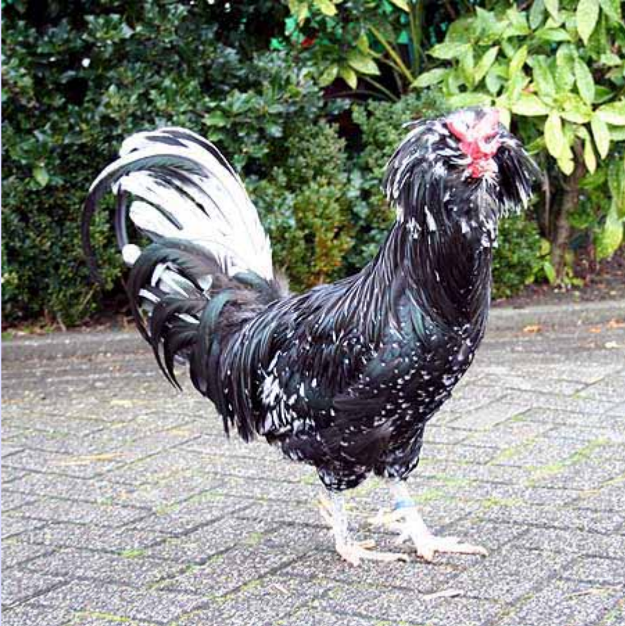
Foto: Houdans hebben vijf tenen, een kuif en baard, en ook een bijzondere kamvorm; de zogenaamde bladerkam.

Het bestuur van De Franse Hoender Club helpt op actieve manier mee om het bestand van de in Nederland erkende Franse rassen op peil te houden en probeert altijd te zorgen dat er bruikbare fokdieren zijn van de Franse rassen die de leden fokken.