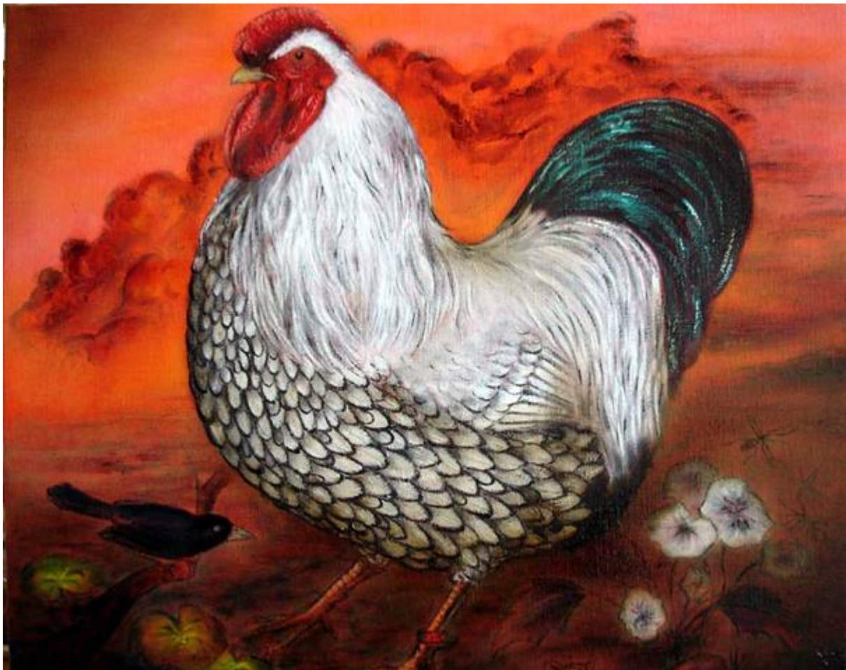
Wyandotte schilderij door: Emilio Blasco, Barcelona Spanje