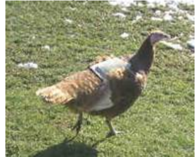
Kalkoenen met zadeltje.